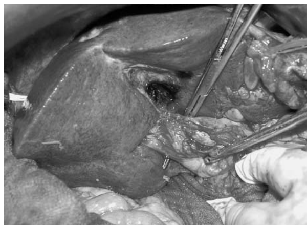
図2 a. 右グリソン枝のテーピング。

1996年から2008年までの肝葉切除症例102例に対して器械縫合器を使用した。従来の結紮、刺通結紮や連続縫合と比較して、短時間で安全な脈管処理が可能であっ