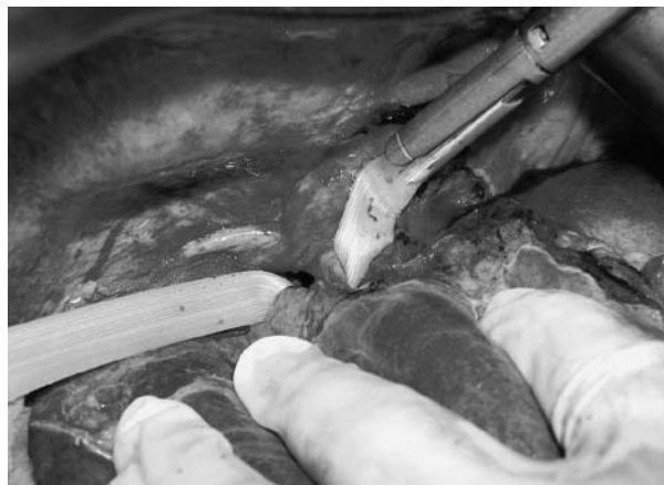
図2 b. ペンローズドレーンをガイドとし、縫合器の片方のアゴを組織間に挿入する (上：右グリソン枝、下：右肝静脈の場合)。