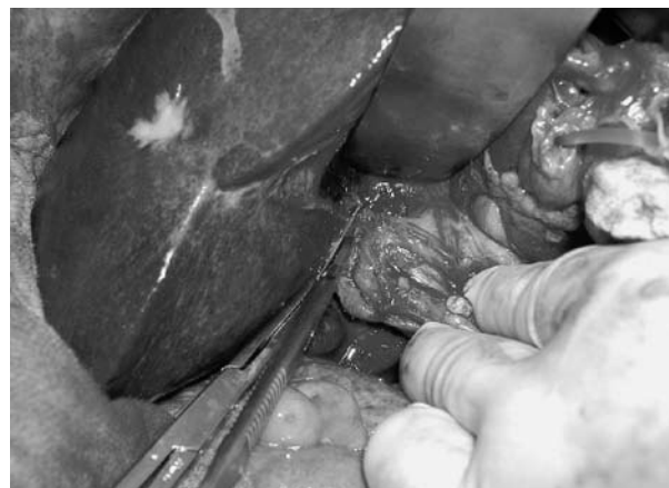
図2d. メスを用いて、staple lineの末梢でグリソン枝を切離。肝側はラフに縫合結紮しながら行う。

器械吻合導入の経緯は、グリソン右枝は左枝に比べて短く、かつ、かなり茎の太い症例があり、単純な二重結紮や刺通結紮では結紮強度の不足をきたす症例があること、あるいは、結紮糸が容易に脱落する症例があったことによる。本法の導入により、グリソン一括処理がより安全かつ短時間で可能となった。前述したように、プロキシメイトバスキュラーやロティキュレーターを使用すれば茎の太いグリソン右枝でも、その縫合強度は確保される。ごくまれに動脈性出血に対して補強を必要とする症例がある。この際は、反対側の脈管を巻き込む可能性を避けるために、staple line間で行うことが望ましいと思われた 4) 。