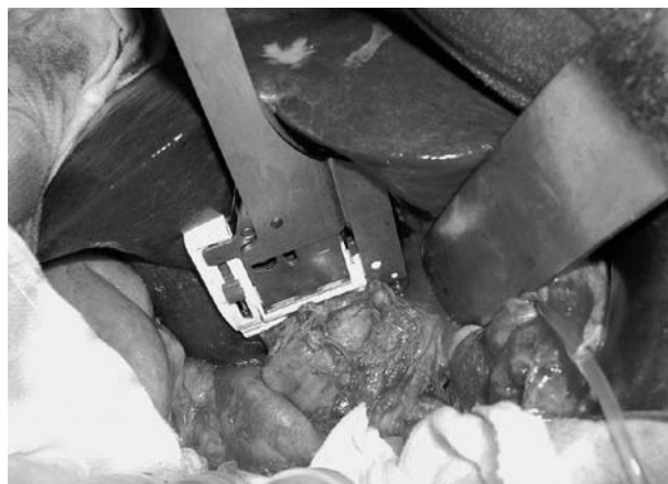
図2c. 仮締めにより、余分な組織の巻き込みのないことや肝変色域を確認する。

導入早期に表2に示すような合併症を経験し、また、これまでに術式変更を7例に経験した。肝門部グリソン鞘一括処理に関する合併症2例は、自動切離の可能な肝静脈と同じ自動縫合器を用いたところ、グリソン鞘の閉鎖が不十分で術後出血を認めた症例と、グリソン鞘の断端補強を行っていた際、これをstaple lineの中枢側で行い、左側胆管が狭窄した症例である。これ以降、グリソン鞘の閉鎖補強が必要な際は、staple line間で行うようにし、同様の合併症は発生していない。肝静脈に関しては、初期の数例は安全性を危惧してやはりナイロン糸で補強を行っていたが、現在は行っておらず、術後出血などは経験していない。術式を変更した7例は、グリソン一括処理から個別処理への変更であり、グリソン枝そのものが縫合器より大きいことや周囲の癒着また巨大腫瘍によるものであった。(表2)