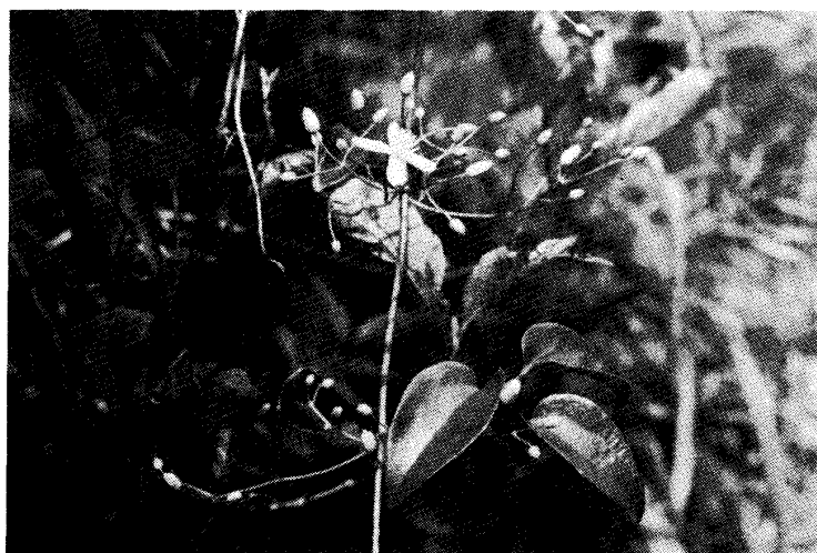
Photo 6. Clematis meyeniana Walp.