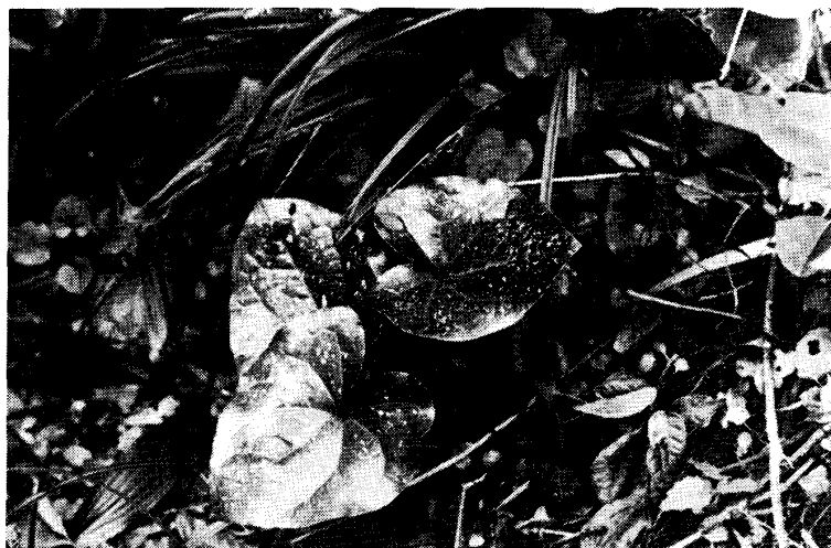
Photo 5. Asarum tokarense Hatus.