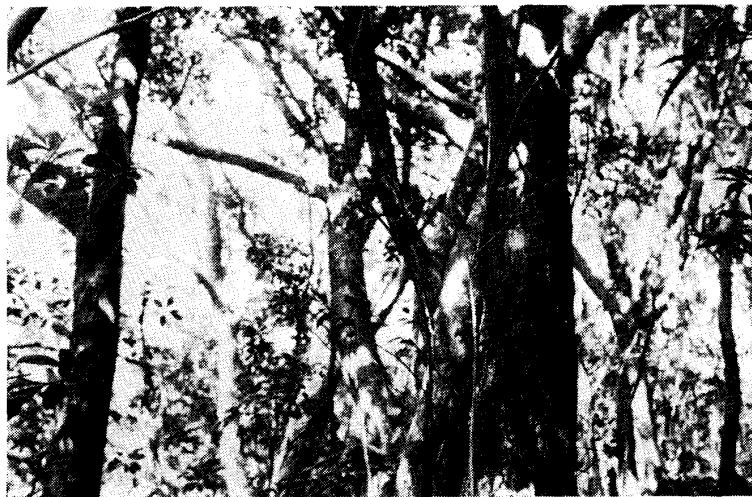
Photo 4. An inner view of the Castanopsis sieboldii sociation.