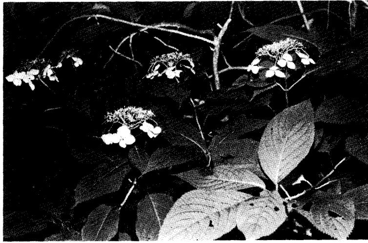
Photo 9. Hydrangea macrophylla ssp. serrata Mak.