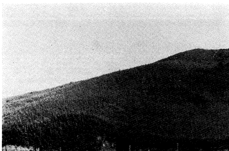
Photo 2. A view of the Pleioblastus linearis sociation seen from a distance.