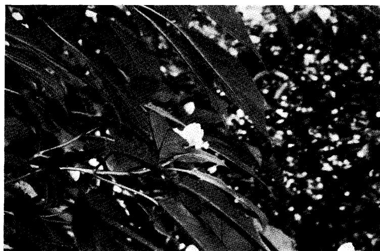
Photo 8. Hydrangea involucrata Sieb.