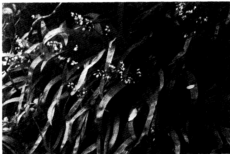
Photo 11. Alectorurus yedoensis Mak.