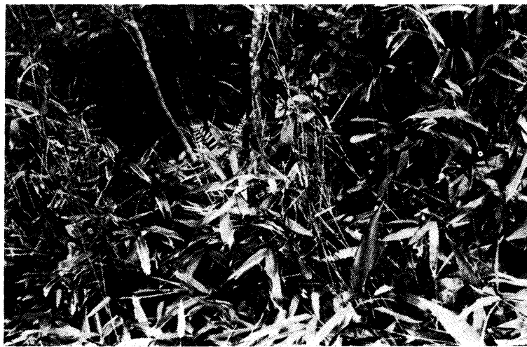
Photo 10. Sasa borealis Mak.