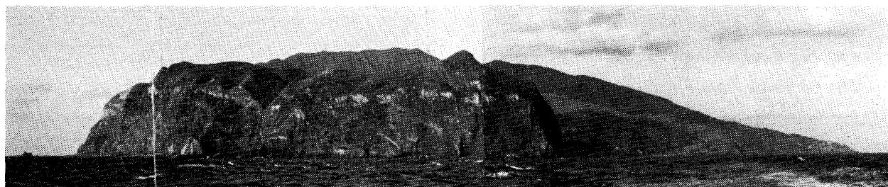
Photo 1. A view of Kuroshima Island beyond the sea.

Plants with its southern limit of distribution in the Kuroshima Island: Sasa borealis Makino, Calystegia japonica Choisy.