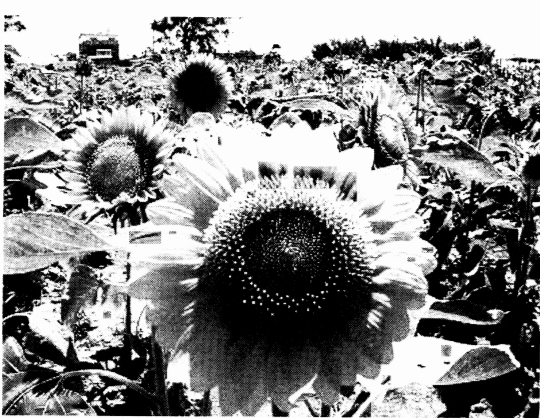
図4 向陽農場の向日葵

台湾休閒農業の事例を紹介する本は4冊を紹介しよう。『元氣散歩』（行遍天下特搜小組，2005年）『活力散歩』（行遍天下特搜小組，2006年）『台湾農場の自由行』（金時代出版社，2005年），と『主題農場』（環興出版社，2008年）である。