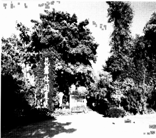
図 1 花露休閒農場