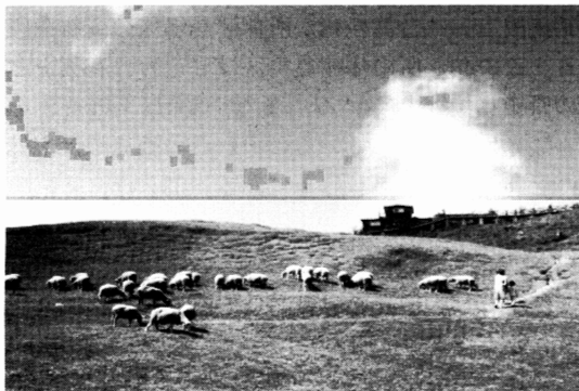
図3 宜蘭香格里拉農場