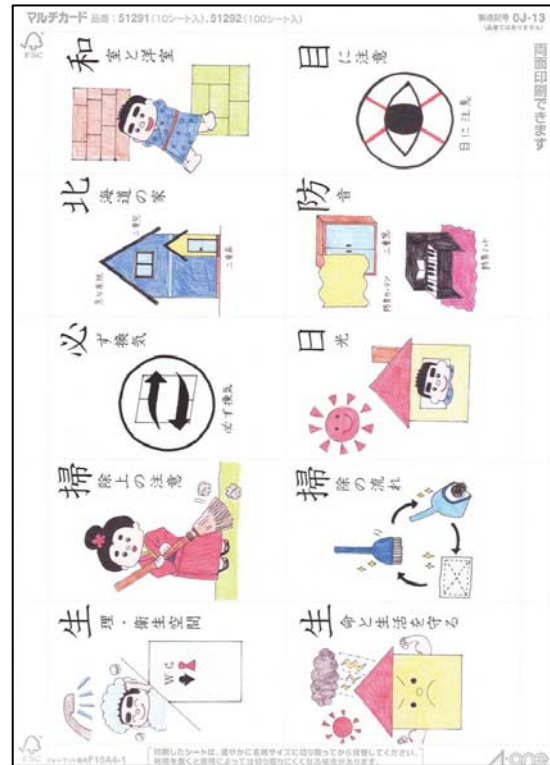
図1. 開発教材の一部（絵札）

プレ授業およびヒアリング調査より、総合的に非常に高い評価を得た。「ぜひ、使用したい」という回答もあり、課題等を改善することで十分授業で使用できる教材であることが予想される。