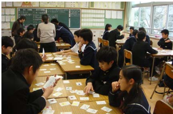
写真 1. 開発教材実施の様子①

とめ時において、1%水準で有意な差がみられた。感想では、「遊びながら楽しく復習することができた」、「絵や文章が分かりやすく住居の内容が頭に入った」、「今までにない授業で楽しく学習することができた」、「グループで活動し、楽しく学ぶことができた」といった回答がみられた。