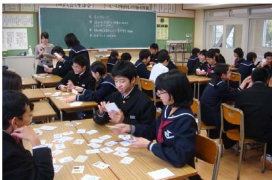
写真 2. 開発教材実施の様子②