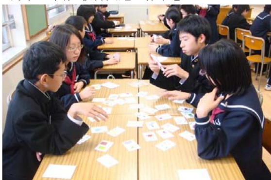
写真 3. 開発教材実施の様子③

高等学校（高校生 30 名）で実践した結果、中学校の内容の振り返りについては、導入時（29 名）「振り返ることが出来た」73.3%、かるたを用いた授業手法については、導入時「面白かった」36.7%、まとめ時「面白かった」75.9%であった。授業の難易度については、導入時「難しかった」3.3%、まとめ時「難しかった」3.4%、導入時「かるたを用いた授業住居の領域に興味を持てた」83.3%であった。感想では、「楽しく学習できた」、「グループで盛り上がった」、「楽しく復習できた」、