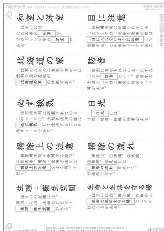
図2. 開発教材の一部（読札）