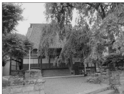
法成寺跡

また、広島地方においても、廃寺もしくは活動を停止している寺院の多くに共通点を見出すことができる。それは、廃寺に至る寺院の多くが、自らの檀家を持つことなく「けきょう」を中心に経営を行う寺院であるということである。けきょうとは、檀家が所属する「師匠寺」が遠方であり参拝することが困難なため、檀家の籍は師匠寺においたまま、自宅近所の寺院に法要などを依頼する体制のことである。そのため、近隣住民への勤行を主な活動とし、自らの檀家を持たない寺院も数多く存在する。広島地方の寺院では、この檀家でない近隣地域の住民のことを「預かり門徒」と呼んでいる。