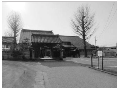
廣濟寺 右手中駐車場が善立寺跡

こうした状況の下、活動停止寺院もしくは廃寺をみていくと、その多くが「寺中」と呼ばれる寺院であることがわかる。寺中とは森岡が、学術用語として使用している言葉であり 38 、高岡地方では「りょう」と呼ばれることも多い 39 。寺中の多くは「本坊」と呼ばれる親寺の境内にあり、通常、寺中は檀家を持つことなく本坊檀家への勤行 40 によって経営を行う。そのため大きな伽藍を有する必要がなく、住職家族の住居と仏間程度の作りとなっている。この本坊と寺中の関係について森岡が、1962年（昭和37年）の時点においてすでに「本坊・寺中下道場の関係は解体へ方向を辿りながらも解体しきれず、弛緩しつつ存続している 41 。」と指摘するように、正式な契約関係もなく、極めて曖昧な関係の中、これまで維持されてきた制度である。それが、森岡の指摘から50年を経ていよいよ本坊と寺中との関係が解体しつつある。それは、森岡の指摘した時点から2世代を経て、各寺の住職継承のタイミングで再び問題化してきたものである。住職継承は、後継者指名がうまく行われればよいが、そうでない場合、鹿児島的事例でも示したとおり、住職継承が寺院にとって重大な局面となる。それが、高岡地方における廃寺問題の根源にもある。