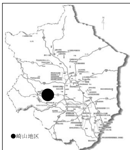
伊佐市地図 (伊佐市HPより)