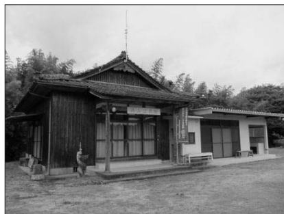
崎山説教所跡

崎山説教所と光泉寺は、その設立に共通点を見いだせる。それは、崎山説教所と光泉寺は共に番役によって設立された寺院であるということである。「番役」とは県内各地で呼ばれる呼び名であり、寺院から遠方の地域で、寺院へ参拝する不便さから法要などを僧侶に変わり執り行っていた者の呼び名である。主な役割は、地域で死者がでた場合の枕経、通夜、中陰法要な