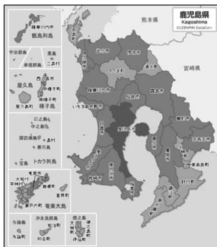
鹿児島県市町村図 (goo 地図より)

このようにみていくと、鹿児島県の廃寺の要因として、ひとつには過疎の問題を否定することはできない。崎山地区、木津志地区ともに過疎地域であり、今後人口の増加が簡単に望める地域ではない。しかし、現在においても崎山地区99世帯、木津志地区64世帯あることから考えて、厳しい寺院経営が予想されるものの、決して経営できない状況とはいえない。実際、鹿児島県南さつま市の秋目地区にある正法寺は、同地区が人口112名、世帯数67戸 31 の中、経営されている。そう考えると過疎のみを唯一の要因と捉えることは出来ない。またその他の要因として、所属寺院より遠方であったため建立された出張所がその役割を失ったための廃寺であったとも考えられる。設立当初は、所属寺までの距離が遠かったための出張所であったが、その後の交通機関の発達、マイカーの普及などによって、その必要性がなくなったものともいえる。しかし、設立の目的は出張所であったとしても、地域住民の意思によって独立を果たし維持してきた寺院を易々と、その目的を終えたということだけで、廃寺にできるとは考えにくい。加えて、鹿児島県の2つの事例には、住職の後継者が不在だったことが大きな要因であったといえる。崎山説教所の住職には子どもがなく、外部から招聘することもなかった。また、光泉寺住職には子どもがいたが、住職を継ぐ意志がなく後継者不在となった。もちろん、過疎による今後の寺院経営に懸念を持ったための後継者不在だったとも考えられる。しかし、なにかしらの方策を持って後継者を指名し、住職継承がうまく進んでいれば、結果は違ったものであったとも思われる。