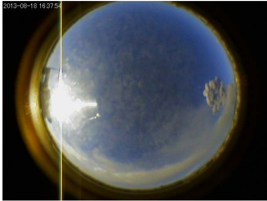
図3：全天画像カメラの記録事例 (2013年8月18日16時37分54秒) (上から時計回りに、南、東、北、西の方向)