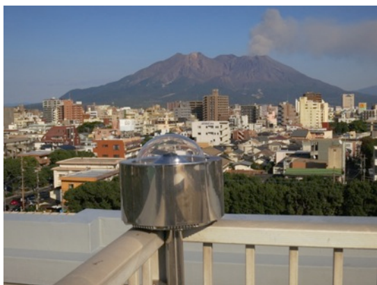
図2：研究棟屋上に設置した全天画像カメラ

(2) 記録映像の蓄積と気象基礎データの配信を行う web 型データベースの構築について