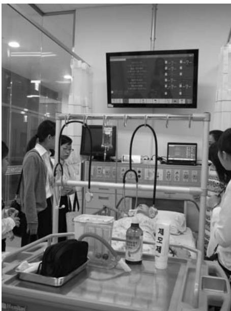
写真4 SPRINGセンター見学の様子

まずは、引率者として参加する教員の旅費等の資金面の確保である。国際交流における財政面での基盤の確保は、他大学でも課題となっているが 4)6) 、研修に参加する学生の経費も含めて確保できるよう外部資金の獲得も視野に入れた取り組みが必要である。加えて、学生が鹿児島大学学生海外研修支援事業を通じて財政的な補助を受けるには、正規の授業科目であることが求められる。学生間の認知度も上がり、この研修に参加することを目