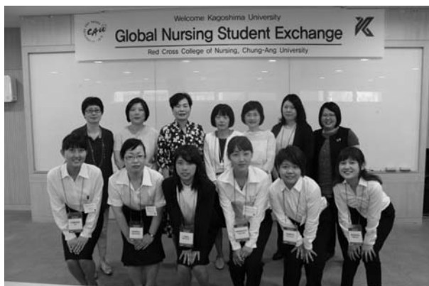
写真 1 CAU でのウェルカムセレモニー Dean, Vice President とともに

CAU ならびにその他の研修先において、講義や説明に用いられる言語は韓国語または英語であった。CAU 側の配慮により、韓国語の通訳者として、日本語を話せる研修先の職員や CAU の学生を配置して下さり、学生が研修しやすい環境を整えて頂いた。しかし、英語で実施される講義や説明は十分に理解できない学生もあり、また、日本と異なる保健・医療・福祉のシステムについては理解に戸惑う場面も見受けられたため、必要時引率