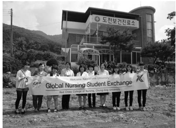
写真5 Dojeon 保健診療所の前にて

また、教員は、一看護者・一教育者として、学生海外研修を通じて韓国における看護教育や保健・医療・福祉のあり方について学ぶ機会を得ることができる。CAUには、1フロアを占めるSimulation Practice in Nursing (SPRING) センターがあり、その見学や演習への参加を通して、多領域にわたる充実したシミュレーション教育や技術教育の評価の実際について学ぶことができた(写真4)。また、今回視察した、保健診療員の活動は大変興味深いものであった。保健・医療へのアクセシビリティが悪い農漁村地域に設置されている保健診療所で活動する保健診療員は、看護職でありながら100種類以上の薬剤の処方権を持ち、住民に最も近いプライマリヘルスケアの提供者である。保健診療員が、住民の健康を守るために看護師としての専門性を発揮しながら、いきいきと活動する様子を拝見し、自律して働く看護職としての面白さ・醍醐味を再発見するとともに、それぞれの教員の背景の中で看護者の自律について考える良い機会となった(写真5)。山本は、「海外の看護を知ることで、日本の看護の中の常識を絶対的なものではなく、相対化して見るができるようになる。海外を経験することによって逆に、より深く日本を知ることになる。」 5) と述べている。今回引率教員は、それぞれ海外で看護を学ぶ、