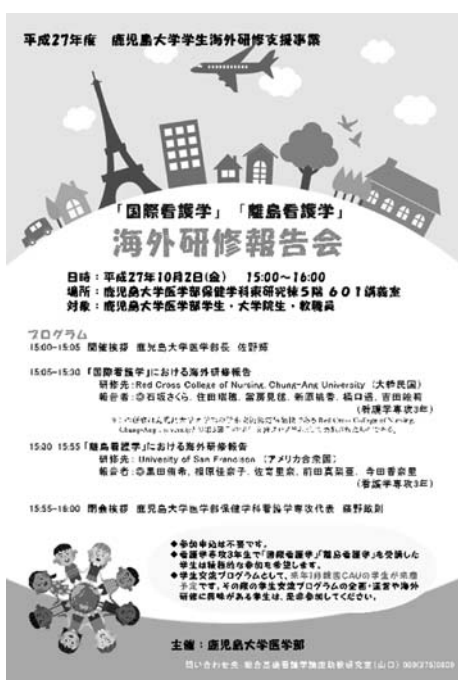
図2 海外研修報告会のリーフレット

機会となることを期待して計画した。この報告会の日程調整やリーフレットの作成、教員・学生への周知等の企画・運営は、学生交流WG委員長と引率教員が中心となって実施した。医学部長と専攻代表の挨拶を頂き、例年よりフォーマルな形式での開催となったが、発表学生は自信を持って自らの経験を発表していた(図2、写真3)。また、学生からは、自分たちに続いて多くの学生に海外研修に参加してほしい、次回CAUの学生が本学を訪問する際には積極的に交流に参加しようというメッセージも発信され、国際交流の継続が期待される報告会となった。