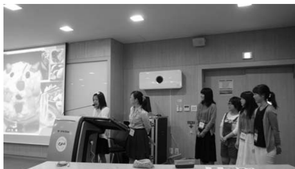
写真 2 学生によるプレゼンテーション

教員が通訳したり、補足説明を加えたりした。本学学生が実施した英語でのプレゼンテーション(写真 2)については、前夜に教員が同席してデモンストレーションを行い、内容や発表の仕方を確認・助言した。また、1 日のプログラムを終えた後、教員同士で学生の学習状況をアセスメントし、翌日の研修が効果的に進むような課題を提示するなど、研修最終日まで、学生の学習意欲を持続させるような工夫を行った。