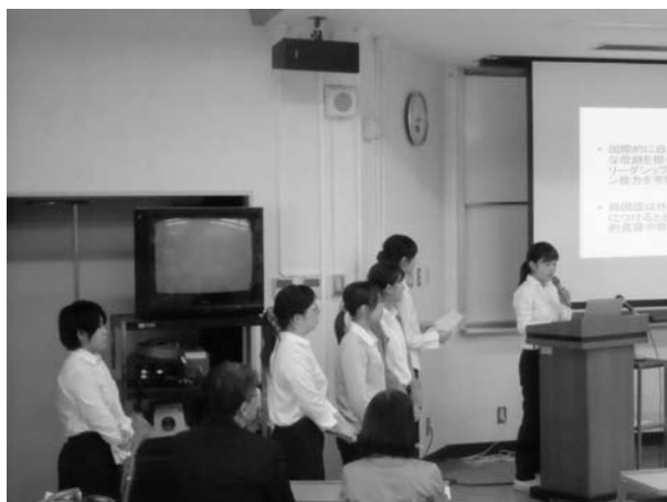
写真3 海外研修報告会における報告の様子