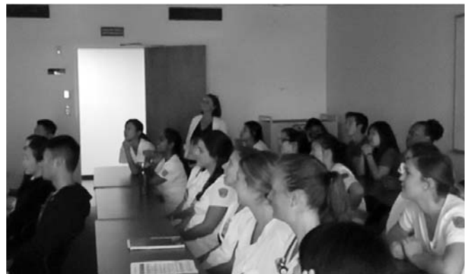
写真1. 本学学生によるプレゼンテーション