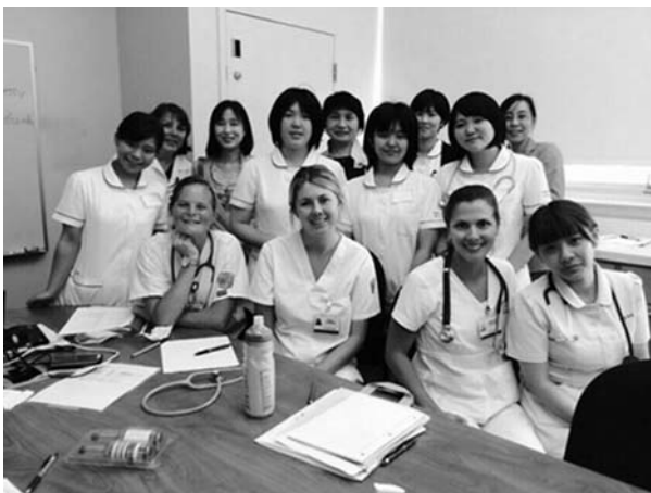
写真2. シミュレーション演習でチームを組んだ学生及び教員と一緒に