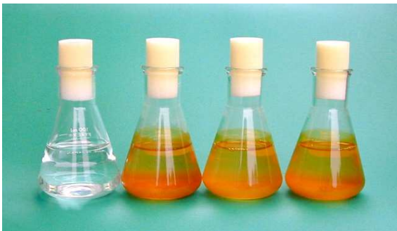
鉄酸化バクテリアを利用したヒ素汚染水の浄化実験 ・バクテリアの投入により、汚染水中のヒ素が沈殿する