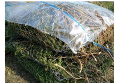
透明なビニルシート被覆した枝条の金網パック

林地残材の一部である枝条に注目し、野外での乾燥過程と降雨の影響を取り除くためのビニルシート被覆の効果に関する実験を行いました。スギの枝条を100cm×90cm×20cmの金網に詰め枝条パックとし、それらを上、中、下の三層に重ねて堆積枝条としました。平成16年11月～12月の35日間に、ビニルシート被覆した堆積枝条としない堆積枝条の乾燥過程を比較した結果、シート被覆がある場合は初期含水率の115%から35%にまで低下したのに対して、シート被覆がない場合は120%から51%へ含水率が低下したことがわかりました。シート被覆による含水率を低下させる効果は、野外乾燥により枝条の低位発熱量を大幅に向上させることにつながります。また、堆積枝条の地面に近い下層部分での乾燥が難しいこともわかり、林地での堆積の仕方も重要であることがわかりました。