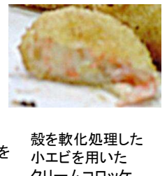
殻を軟化処理した小エビを用いたクリームコロッケ