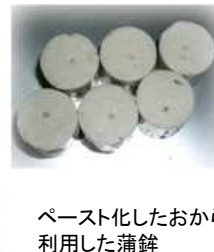
ペースト化したおからを利用した蒲鉾