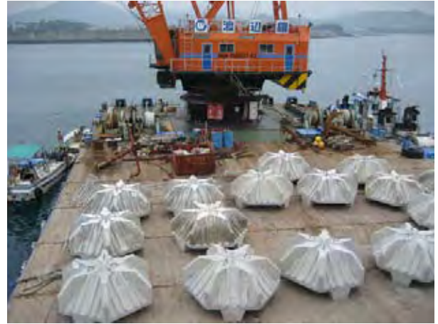
焼酎粕藻場礁 (いきち串木野市沖：2006年5月から実施)