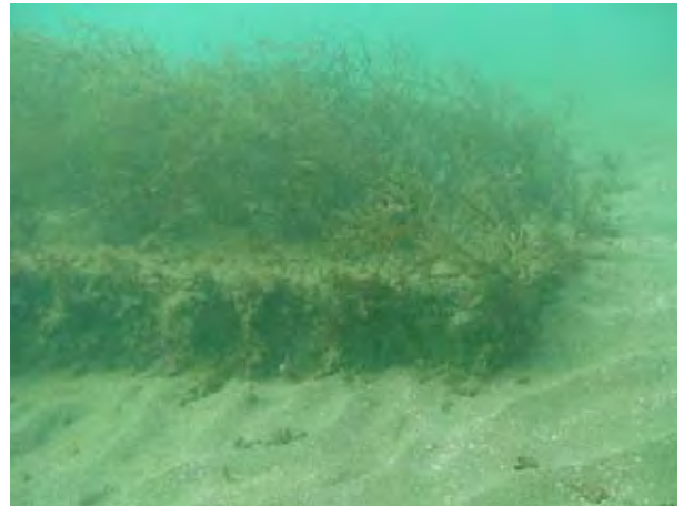
焼酎粕藻場礁 (鹿児島市喜入沖：2006年1月から実施)