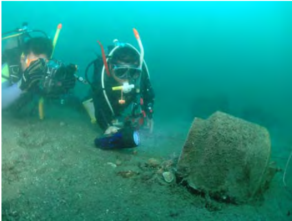
焼酎粕産卵用タコつぼ (鹿児島市鴨池沖：2005年9月から実施)