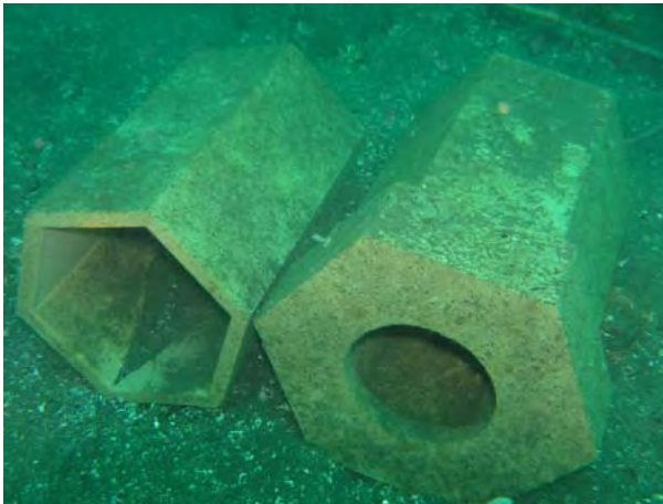
焼酎粕産卵用タコつぼ (始良町重富沖：2006年10月から実施)