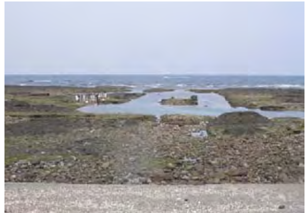
図8 トコブシ溝式養殖場

実験は、2005年3月から西之表市庄司浦地区のトコブシ養殖場内で実施している。この養殖場は図8に示すように、天然の岩場を人工的に削って溝式に造成したもので、水深は干潮時で約0.5 m, 満潮時で約3 mで、海底は平坦な形状をしている。実験には、普通コンクリート、石炭灰配合、焼酎粕配合の魚礁をそれぞれ100基ずつ用いている。トコブシ魚礁の基質を、従来の普通コンクリート、多孔質体の石炭灰を配合したもの、有機成分である焼酎粕を配合したものの3種類を用いて、基質の違いがトコブシの付着、生育状況、およびその他の生物の蛸集や付着状況、海藻類の着生などに与える影響を調べている。2005年3月28日に魚礁を設置し、2005年6月20日にトコブシ稚貝（殻長約2 cm）を魚礁1基あたり10個ずつになるように合計3,000個放流した。その後、概ね3ヶ月に1度の頻度で定期的に調査を行っている。稚貝を放流してから、約11ヶ月が経過した2006年5月15日の調査では、普通コンクリート、石炭灰コンクリート、焼酎粕コンクリートの魚礁に生息していたトコブシの個体数は、それぞれ185個、255個、368個であった。トコブシの歩留率（放流個体数に対する生息個体数の割合）