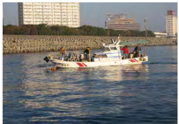
焼酎粕魚礁 (鹿児島市鴨池沖：2007年1月設置)