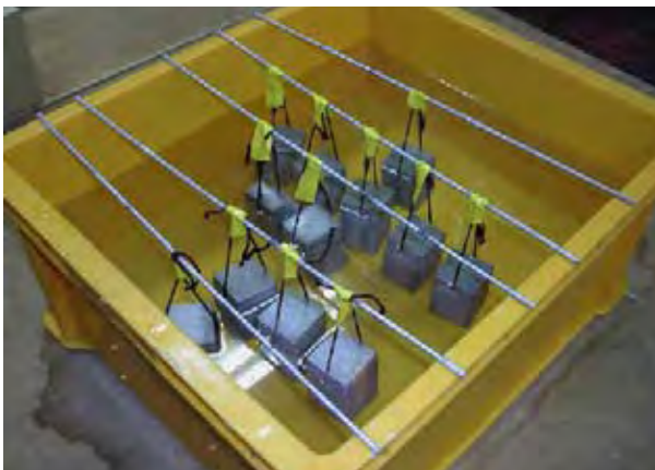
図1 海水中に設置した焼酎粕モルタル

以上のような方法で、海水中に浸漬させた普通モルタル、焼酎粕モルタルの表面に付着した細菌数、細菌の種類を比較した。