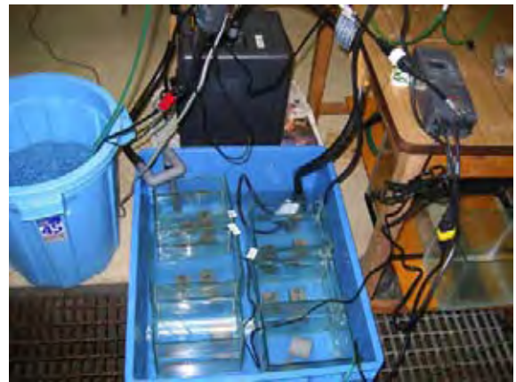
図3 焼酎粕モルタルの水質浄化試験

焼酎粕モルタルの表面に付着するバクテリアの作用による水質浄化作用および生物に与える影響を調べるために、実験水槽内で海産性魚類であるジャワメダカと海産性甲殻類であるヨコエビを飼育し、魚類および甲殻類の排泄物由来の化学物質であるアンモニウム態窒素、亜硝酸態窒素、硝酸態窒素を測定する実験を行っている。実験は図3に示すような水槽で行っており、測定の結果については現在解析を進めているところである。