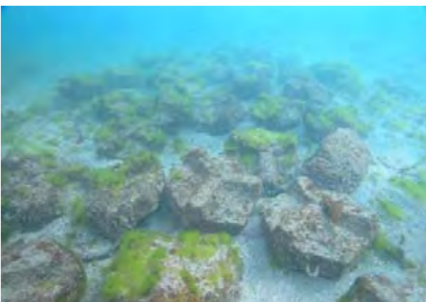
焼酎粕トコブシ魚礁 (西之表市庄司浦地区：2005年3月から実施)