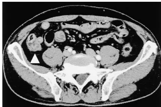
図4. 腹部造影 CT: 虫垂根部から盲腸に不均一な壁肥厚像を認めた.

入院時現症 : 体温35.9 ^{\circ} C, 血圧118/72mmHg, 脈拍62回/分. 胸部には異常を認めなかった. 腹部も平坦であり, 自発痛・圧痛は認めなかった.