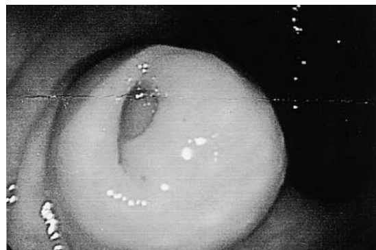
図3. 大腸内視鏡検査: 虫垂開口部に隆起を認め, 虫垂腫瘍が疑われた.

現病歴 : 2006年11月, 検診にて近医の大腸内視鏡検査で, 虫垂開口部の隆起を指摘され, 11月初め, 精査・加療目的に当院に紹介受診となった. 腹部CTにて虫垂腫大を認めたが, 周囲への浸潤所見やリンパ節腫大認めず, 経過観察となった. 2007年1月, 大腸内視鏡検査を再施行するも虫垂開口部の隆起に変化なく (図3), 腹部CT所見 (図4) にも変化は認められなかった. 炎症性疾患は否定的であったが, 腫瘍性病変の可能性も否定できないため, 1月下旬, 手術目的に当院入院となった.