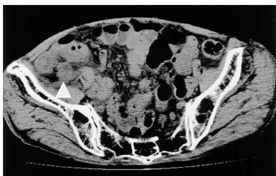
図1. 腹部単純 CT: 回腸末端付近に不均一な壁肥厚像と周囲脂肪織の濃度上昇を認めた.

手術所見 : 右下腹部交差切開で開腹したところ, 膿性腹水は認めなかった. 虫垂は発赤, 腫大しており, 末梢は後腹膜と癒着していたが, 根部には強い炎症所見は認めなかった. 腸間膜を損傷しないように癒着を剥離し, 虫垂切除術を施行した.