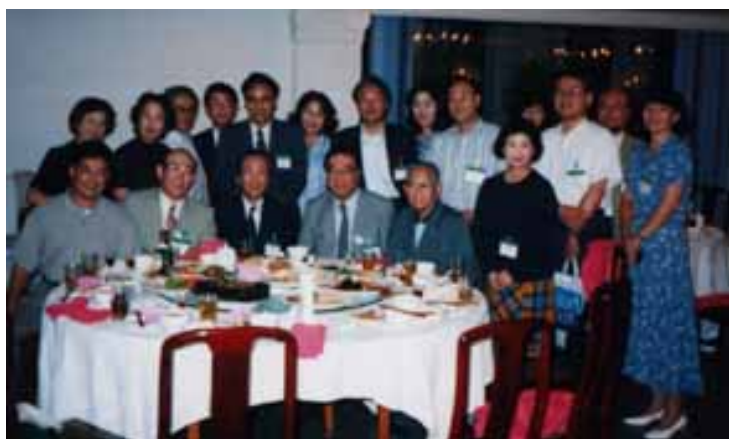
鹿児島からの Social part への参加者を囲んで