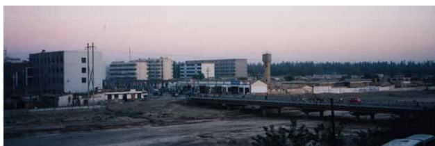
ホテルの窓から見えた枯れた川（敦煌）