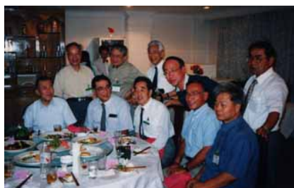
組織委員会メンバー