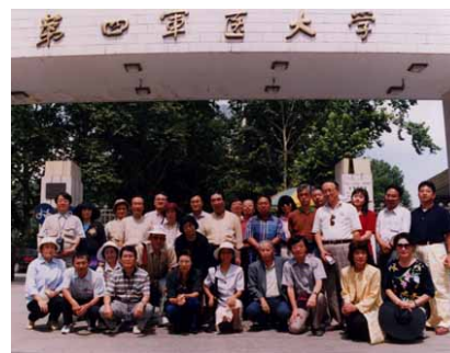
第四軍医大学への表敬訪問

第四軍とは解放軍を意味し、医科大学を有する軍隊は第四軍のみとのことであった。この軍医大学は西安の