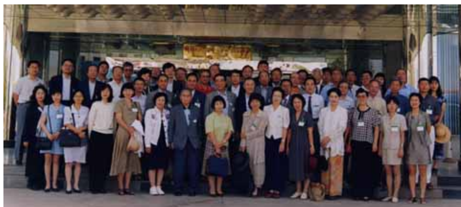
最 敦煌 沙州ホテルの玄関での記念写真