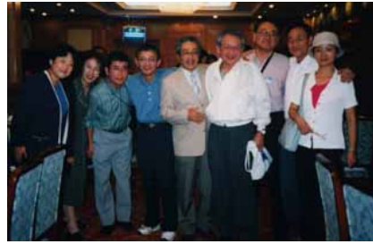
Social part での諸話題の交流

Academic part の実り多い日中の分子病理学の研究者間の交流の他、Social part での諸話題の交流も意義あるものであった。