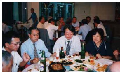
EBV 研究を話題に活発な会話が進むテーブル