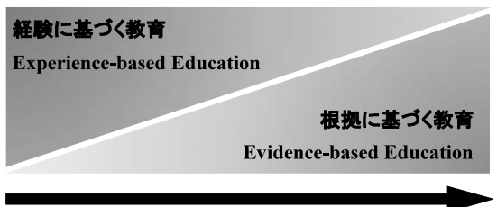
図2. 「根拠に基づく教育」の推進