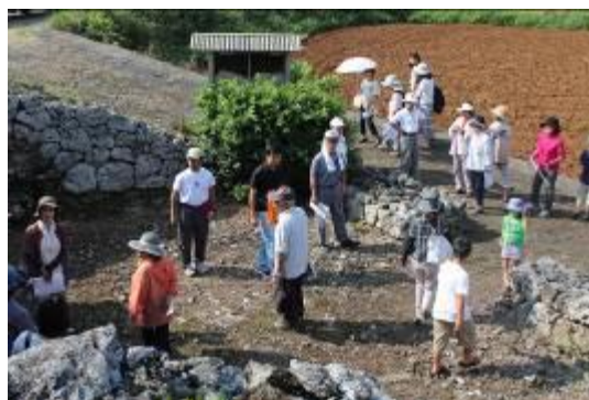
写真9 知名町墓めぐり実施状況

しかし、近年、少子化や過疎化といった社会情勢に伴い、従来から受け継がれてきた墓の文化についての概念が変わりつつあるため、これを契機として、ツール墓をはじめ、身近にある墓についても理解・関心を深めるために公民館講座事業と連携した「知名町墓めぐり」を平成27年度に開催した。参加者は約20名でご年配の方が多く、ほとんどの方がこれまでにツール墓を訪れたことがなく、また、各墓の歴史について学ぶ機会も少なかったという。この講座を通して、墓の構造や見つけた遺物について関心を持たれた方が多いため、本事業を継続してツール墓の普及・啓発活動を実施していく必要性を感じた(写真9)。