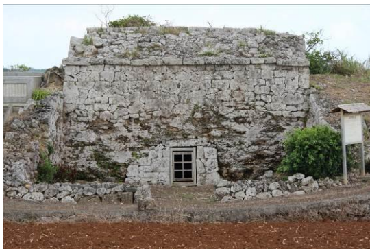
写真1 屋者琉球式墳墓（西より）