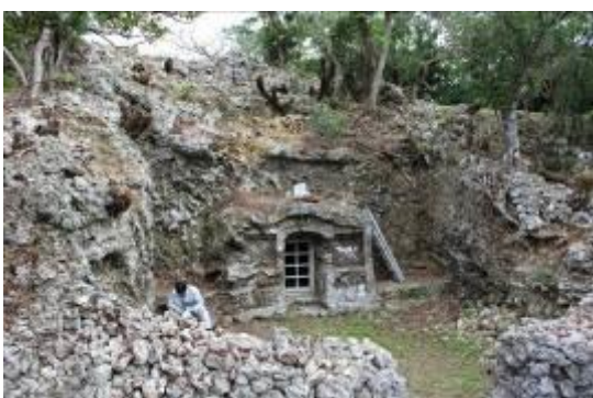
写真3 アーニマガヤトゥール墓（南より）