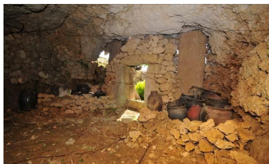
写真6 墓室内の状況（南より）