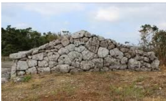
写真2 切妻式の屋根側面（南より）