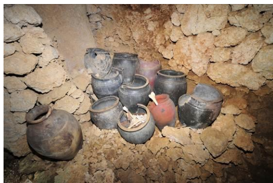
写真8 墓室内左壁側（南より）