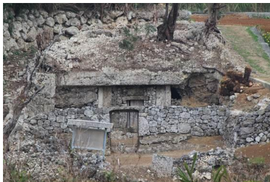
写真5 新城花窪ニャート墓（北より）