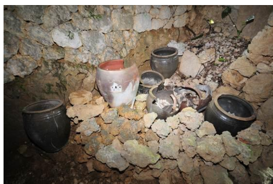
写真7 墓室内右壁側（南より）