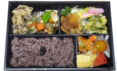
商品化された「薩摩黒膳弁当」