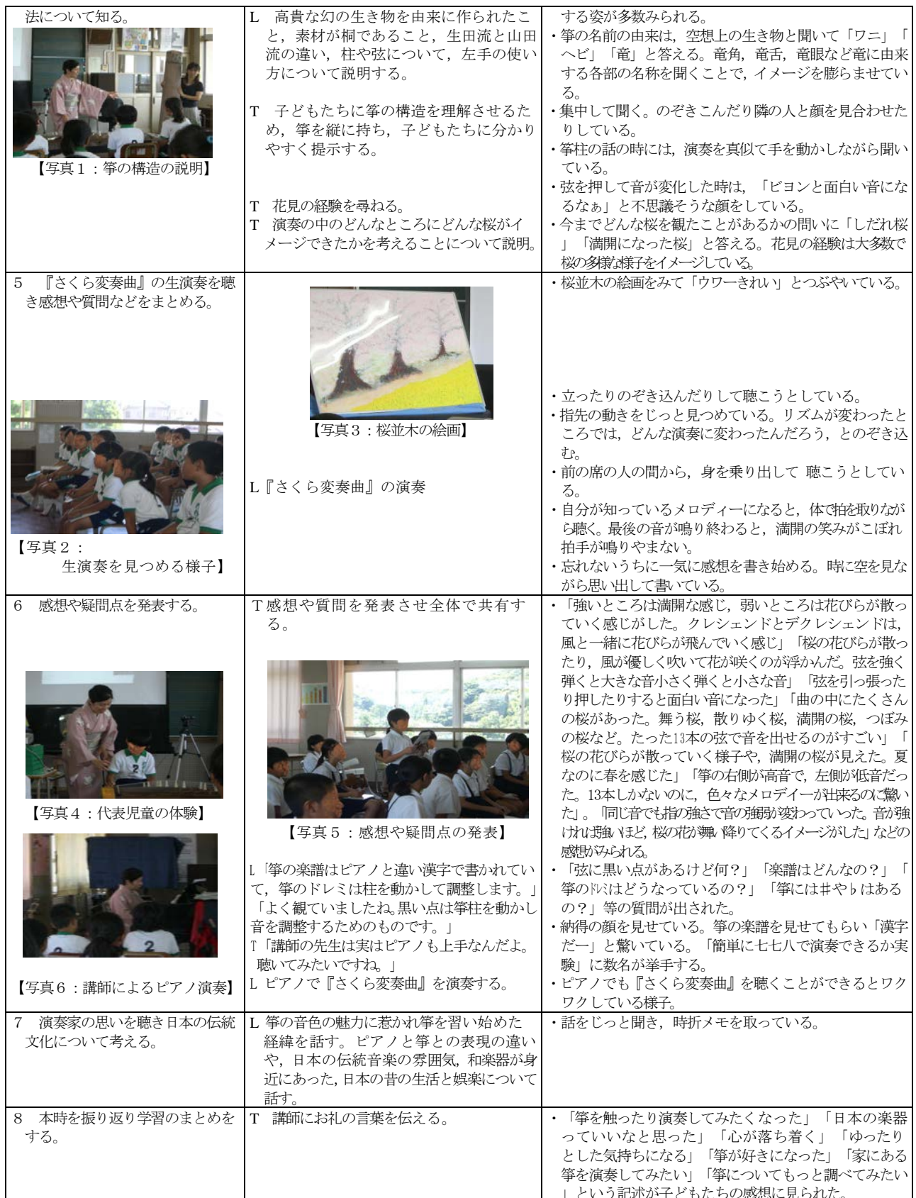
【表3：第2時の授業記録】