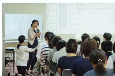
地域での支援活動

2013年度まで地域支援プロジェクトで行ってきた、遠隔地・離島支援を含んだユニークな地域貢献活動が評価され、2014年度からは本研究科の重要な教育研究事業として位置付けられました。このようにして地域支援プロジェクトは、臨床心理学を基盤とした地域支援の臨床実践と実務教育の架橋につながる全ての地域支援活動を含み込む形で発展的に継続してきました。