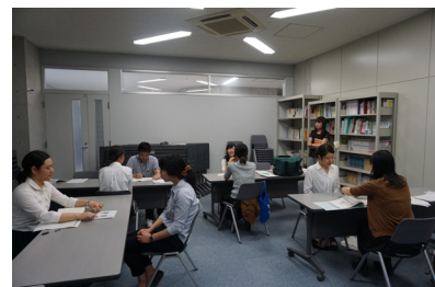
大学院生への実践教育