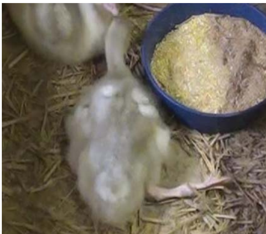
図 2. 脚弱の状況 (対照区)