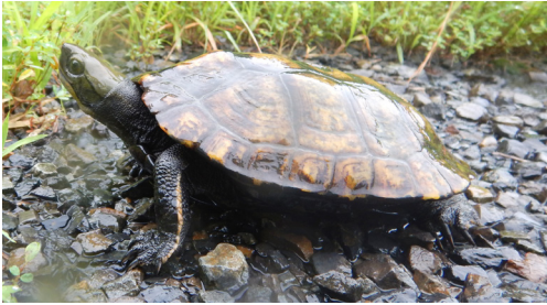
図1. 薩摩半島で捕獲されたニホンイシガメのメス。 Fig. 1. A female of Mauremys japonica from the Satsuma Peninsula.