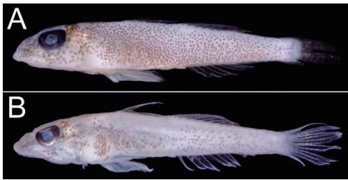
Fig. 2. Preserved specimens of Pleurosicya coerulea from Okinoerabu-jima island, Kagoshima Prefecture, Japan. A: KAUM-I. 122102, 10.4 mm SL; B: KAUM-I. 122106, 13.2 mm SL.