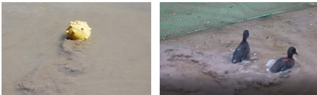
図 3. ロボットとアイガモによって生じた濁水

る際に濁水を発生させており（図 3），アイガモ農法においては濁水で雑草の光合成や発芽を抑制する効果があるとされている[1]。しかしながら，試験終了時における各区のプロテクトケージ内の雑草の密度には差がみられず，本研究ではロボットならびにアイガモが発生させた濁水による除草効果は認められなかった（図 4）。なお，ロボットは水深が 5 cm 未満で移動が困難となり，水深が 10 cm を超えると突起が地面に触れずに濁水が発生しない状況が観察されており，実用化に向けて対応策を検討する必要が示された。