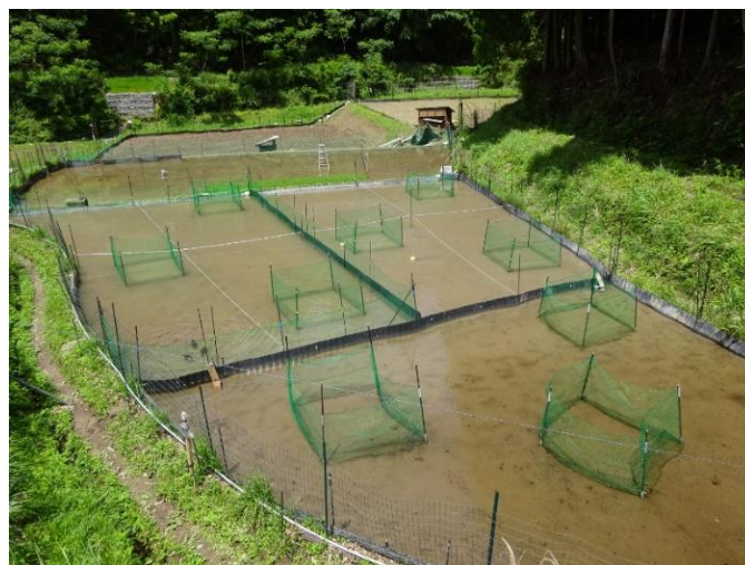
アイガモ区 (左上), ロボット区 (右上), 対照区 (下) ネットで小さく囲んだ部分がプロテクトケージ

得られた結果については、排水口で回収した雑草本数は対照区における単位面積当たりの回収本数を基準値として、これに対するアイガモ区とロボット区における本数の増減をカイ二乗検定により比較した。プロテクトケージ内外の雑草の密度については、一元配置分散分析により各区間で比較を行った。