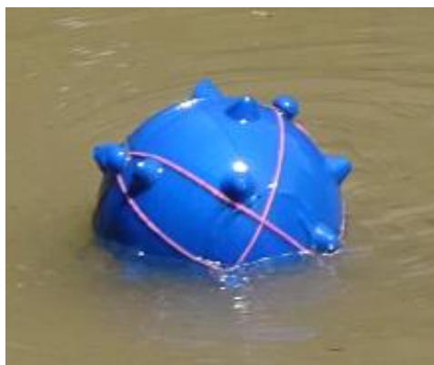
図1. 小型球体ロボット（プロトタイプ）

なお、本研究は鹿児島大学動物実験委員会の承認を得て行われた（承認番号：A21004号）。