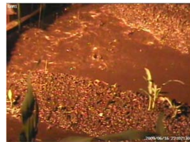
図1 傾斜畑における表面流

※得られた連続撮影画像は(独)農業環境技術研究所のホームページで公開しています。 http://www.niaes.affrc.go.jp/techdoc/movie.html