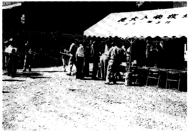
第4図 アンケート回収状況