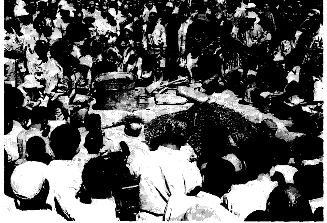
第2図 土着菌の培養の実演