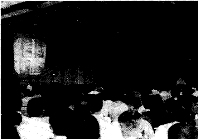
第5図 地域での取り組み者の発表