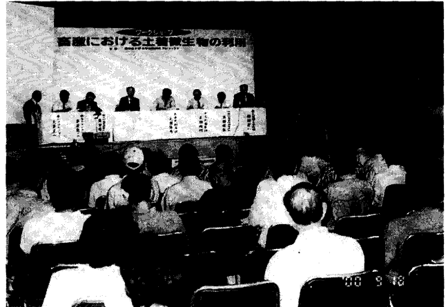
第6図 発表者との検討会