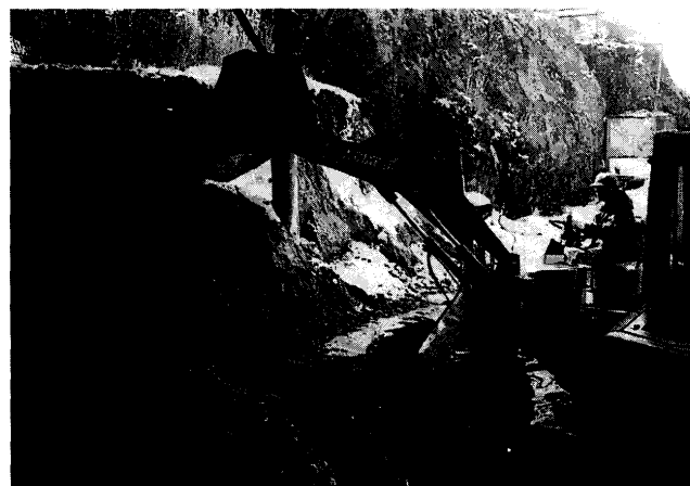
第6図 畜糞尿への利用