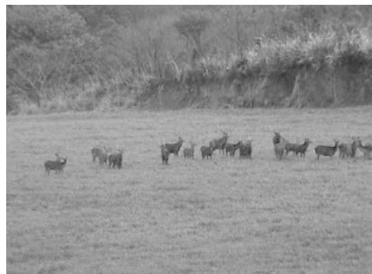
第1図 牧場採草地に侵入した野生シカ (入来牧場内採草地)