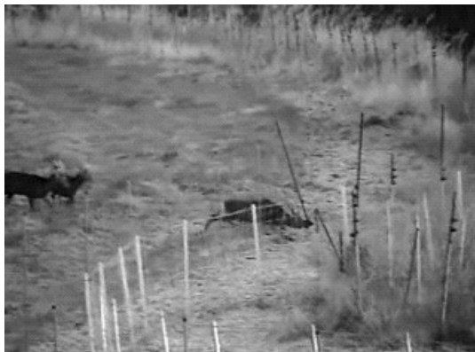
第3図 60-120区より脱柵する雄シカ (右端の野生シカが電線の下から通り抜けを試みている)

区に関しては、ライトセンサスおよび早朝に行った肉眼観察における延べ侵入頭数、1日当たりの最大侵入頭数、平均侵入頭数のいずれにおいても慣行区および45-90区に比べ多くのシカの侵入が認められた(第1表)。さらに、60-120区に侵入したシカが電線を警戒しながらも地面と60 cmの間をくぐり抜ける様子が2007年2月12日に目撃された(第3図)ことから、2段張り電気柵の場合には、電線の高さを45および90 cmに設置することで侵入防止効果が高まることが示された。