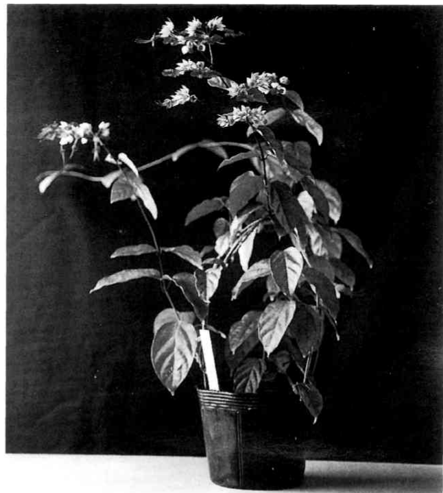
第2図 ベニゲンペイカズラ