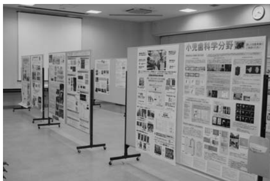
選択科目紹介1：ポスター展示風景

常に面白かった。また、若手研究者発表では、歯学部同窓会にご尽力頂き、昨年度より設立された「鹿児島大学歯学部同窓会奨励賞」を基礎・臨床系各1名を若手研究者に授与する形式に変更して頂いた。若手研究者の熱い話は大学院生のみならず多くの教員の刺激になったかと思えます。その後の懇親会・表彰式でも多くの先生方に参加して頂き、和やかな雰囲気での交流