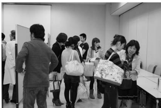
選択科目紹介2：ポスター会場での相談会風景