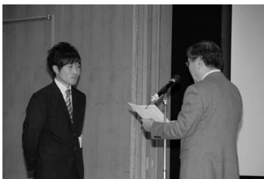
大学院生研究発表会2：口腔先端科学術奨励賞（学生発表）授与式