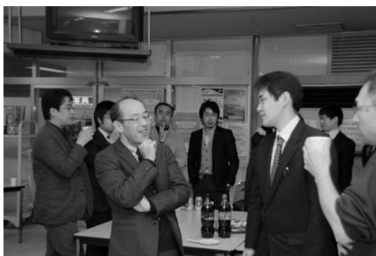
大学院生研究発表会4：大学院生研究発表会 懇親会