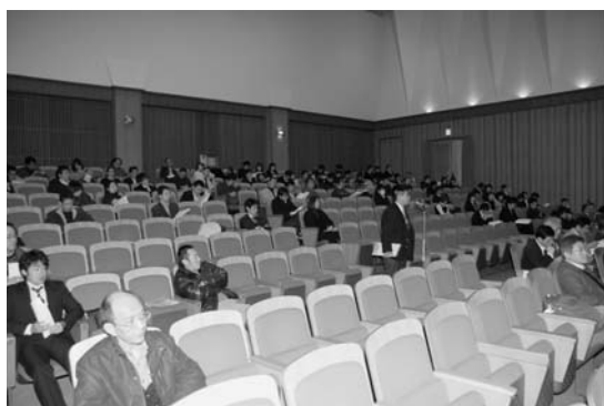
大学院生研究発表会1：大学院生研究発表会 風景