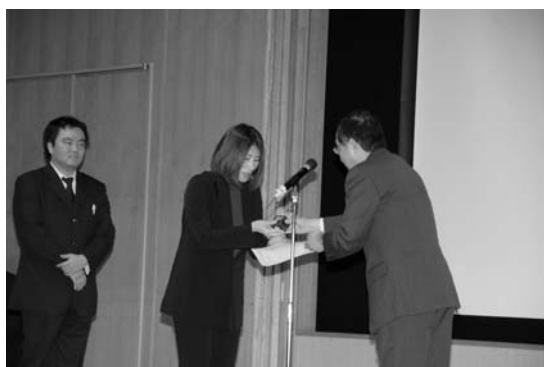
大学院生研究発表会3：歯学部同窓会奨励賞授与式