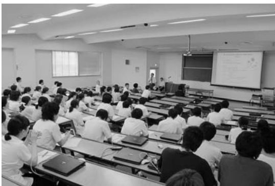
大学院説明会1：大学院説明会：第一部 説明会風景