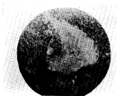
Ditto tissue, showing necrosis.