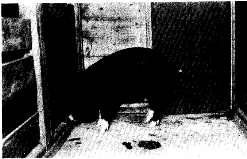
Boar affected by atrophic rhinitis showing nasal hemorrhagic discharge on the floor.