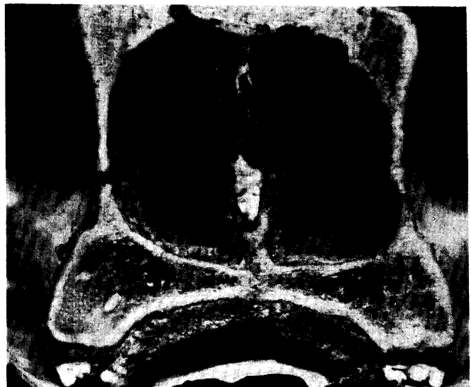
Transverse section of the nasal cavities of above case, showing atrophic disappearance of the nasal turbinate bones.