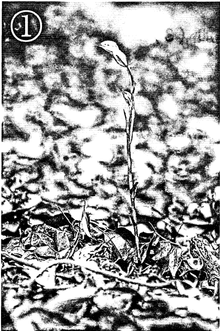
図-1. マヤラン ( Cymbidium macrorhizon Lindl.). 高隈演習林3林班。(撮影日)2007年8月22日。

I B類に鹿児島県カテゴリー (鹿児島2003) では絶滅危惧種I類に指定されている。