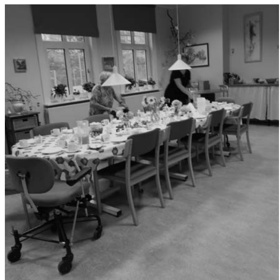
写真1 Dementia House Byhusetの1部屋。訪問時、利用者と職員が朝のお茶会の準備をしていた。