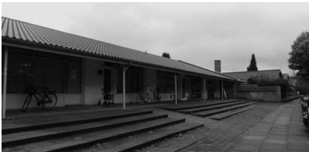
写真2 Kallerupvejの外観。閑静な住宅街にある平屋の建物。

日本においても認知症を呈する方が在宅生活を継続するためには、基本的な生活支援と外出機会、活動の創出やレスパイトケア等多方面の援助が重要である。また、認知症の早期発見・早期診断が可能になりつつある中で