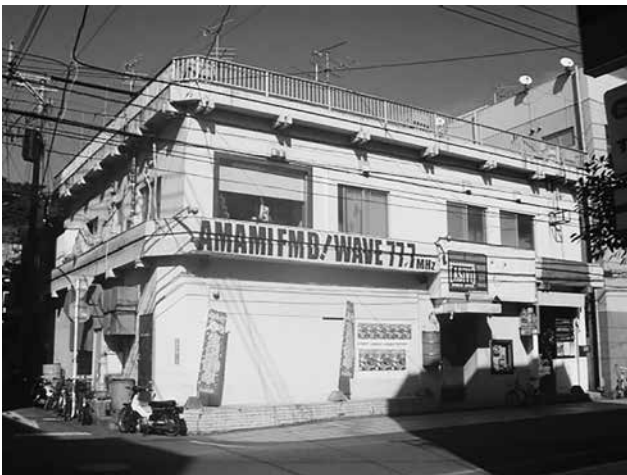
2階にあまみエフエムのスタジオ兼事務所、 1階はロードハウス・アシビ

その後、ハード面では地元の唯一の電波業務関わる株式会社 奄美通信システムなどの強力な技術サポート、そしてスタジオ・事務所工事と放送制作などのソフト面と資金では私が経営するイベント会社、有限会社アーマイナープロジェクトがサポート、更には地元の500名近くのサポーター会員によって、2007年5月に「島ツチュの島ツチュによる島ツチュのための島ラジオ」というキャッチコピーを掲げ、あまみエフエム ディ！ウェイヴが九州総合通信局管内での離島初として開局しました。スタッフは未経験の島興しに賛同する30代、5名で（現在11名）スタートしました。放送内容は、南海日日新聞・奄美新聞など地元二紙の記事提供による島のニュースや天気予報、空路・航路、お悔やみの案内、島口格言や島口ニュースなど島に特化した放送を行っています。