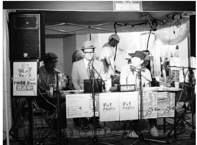
島にもラジオがあったら・・・ イベントでの模擬パフォーマンス

島内でのメディアといえば、もちろんテレビ・ラジオ等、約 380 Km離れた県本土からの放送を通しソトの情報を受信できます。そのような一方向で雨のように降り注ぐような形でなく、井戸や泉のようにウチから湧き出るものを自ら浴びるような島の情報の循環・感化のような日常スタイルが構築する伝達手段は？と模索している中で「ラジオ」という音声媒体での情報伝達がよいのではないかと気づきます。新聞・本・インターネット等の能動的媒体には意識的に触れますが、テレビはじめラジオなど受動的媒体は無意識に触れることを考えると、これまで無意識に劣等感が生まれてしまった状況において、アイデンティティを育むにはその無意識に改めて、島のモノゴトによる情報や価値