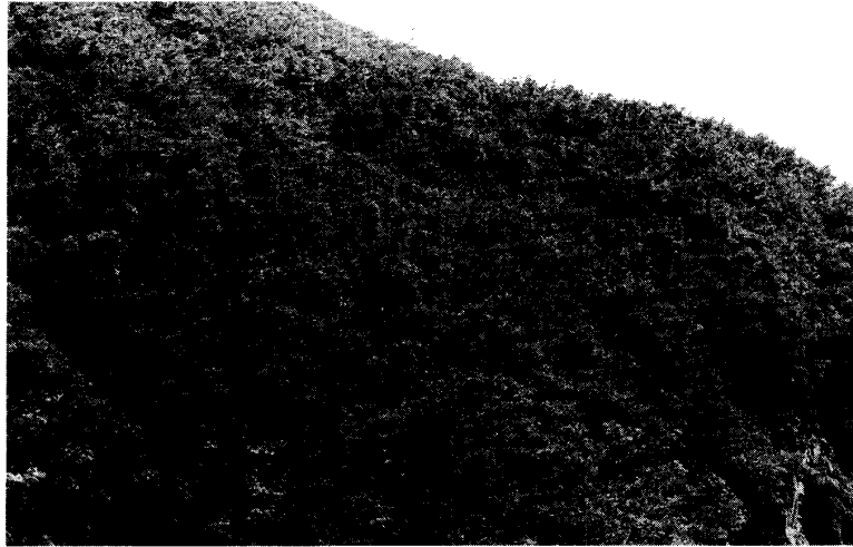
Photo 5. Inner view of Quercus phillyraeoides forest.