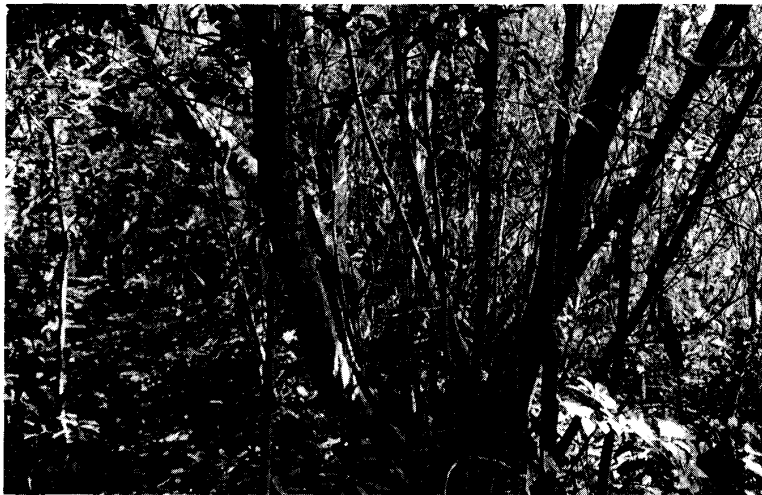
Photo 3. Rich litter in Lithocarpus edulis forest.