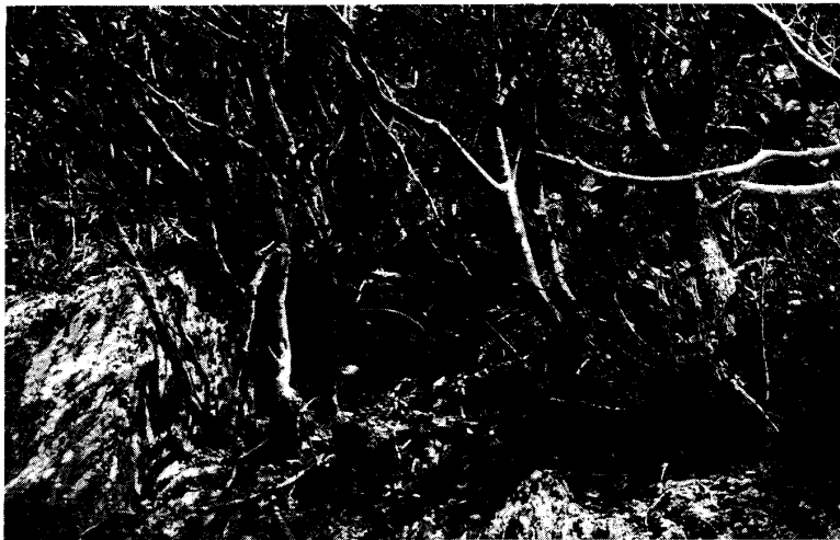
Photo 6. Poor litter in Quercus phillyraeoides forest.