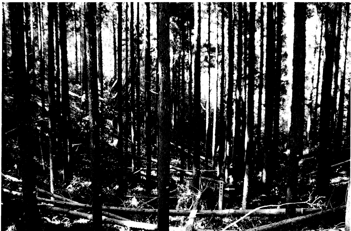
写真-1, 2. 除伐実行前(写真-1)と実行後(写真-2)の林相。 矢印は円形プロットを示す。