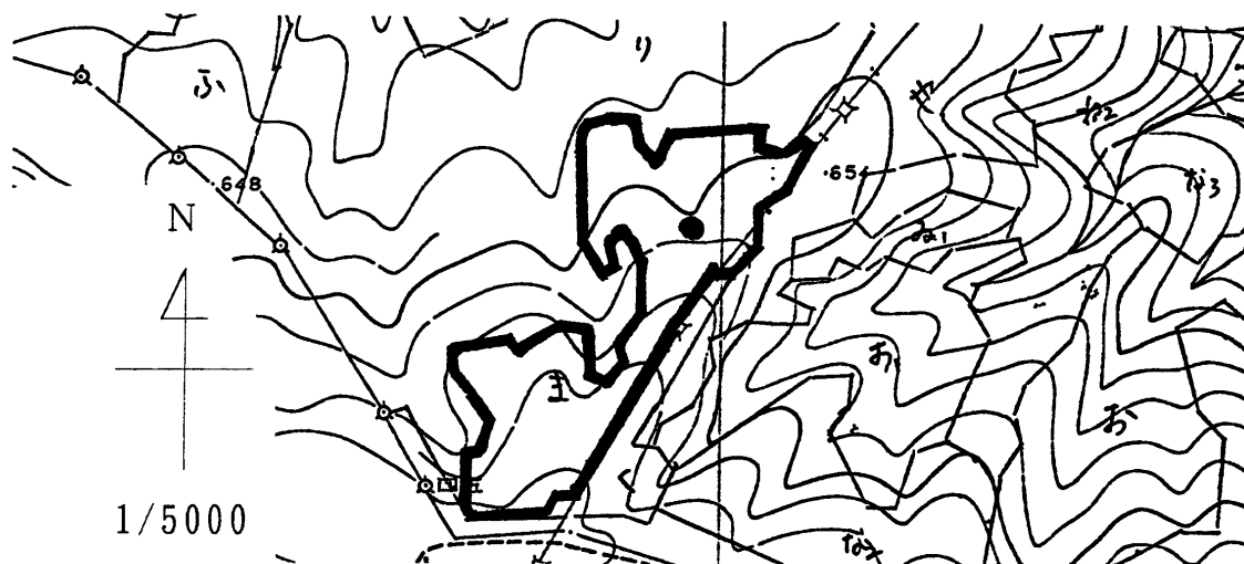
図-1. 調査箇所; 8林班ま小班 (●は固定測定地の設定箇所を示す)

実行前と実行後の本数, 平均胸高直径, 平均樹高, 材積の変化を図-2に示し, 実行前と実行後の林相の変化を写真1, 2に示した。また調査野帳を表-1に示した。