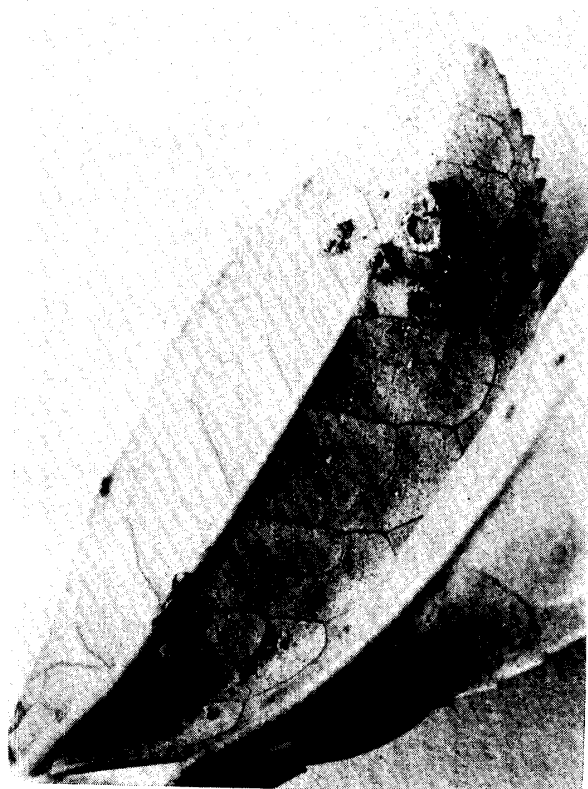
Fig. 1. Lesion on leaf.

本病の発生は、放任園や未整枝の幼木園に多く、また、一つの茶園では、周辺部の風当りの強い所に多発する傾向が見られる。