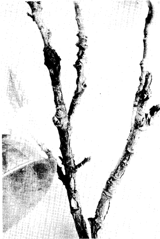
Fig. 2. Lesion on stem.

色，円形のコロニーを作る細菌が得られた。これらの分離菌を，健全茶樹の開葉後間もない若い葉に付傷接種したところ，10～15日後に，本病の病徴を現わした。そして，その病斑から細菌の再分離を行なったところ，同じコロニー性状の細菌が得られ，これもまた病原性を有することが認められた。したがって，本細菌が本病の病原菌であることは明らかである。