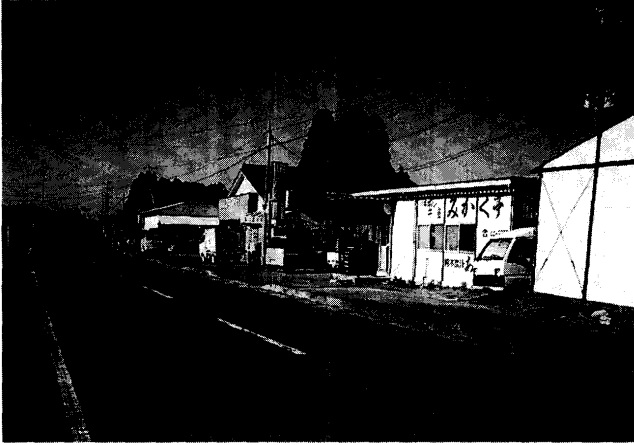
第1図 民家の隣に豚舎を設置