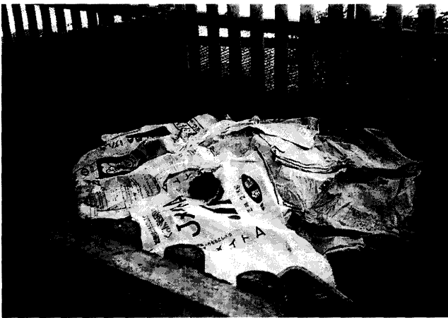
第3図 豚舎内で土着微生物の培養