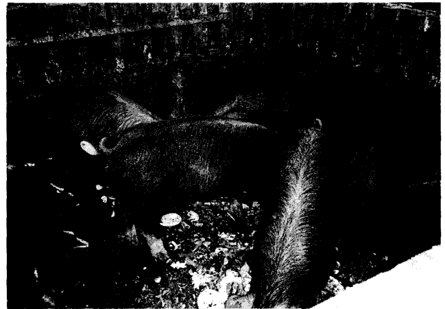
第6図 食品の残査を土着菌と混ぜて床で給与