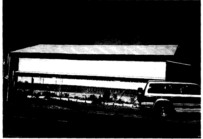
第2図 県道側に上と下に換気口を付けてある