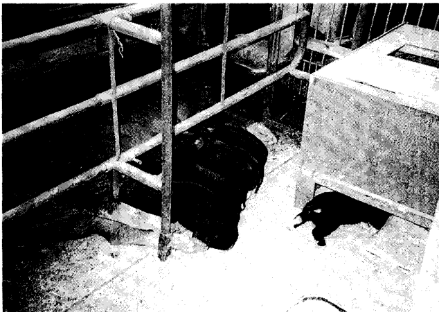
第5図 分娩室で暖房室を設けて哺乳