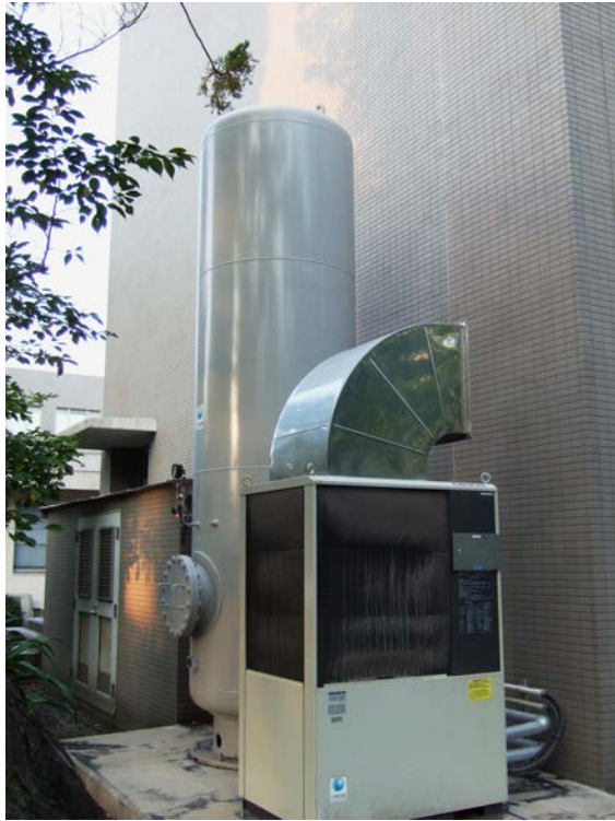
図3. 101室に隣接した屋外に設置された冷却水循環装置（手前）、5 m 3 ストレージタンク（中央）とポンペ庫（奥）