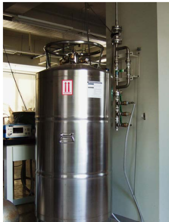
図6. 100 ℓ 液体ヘリウム容器と回収配管