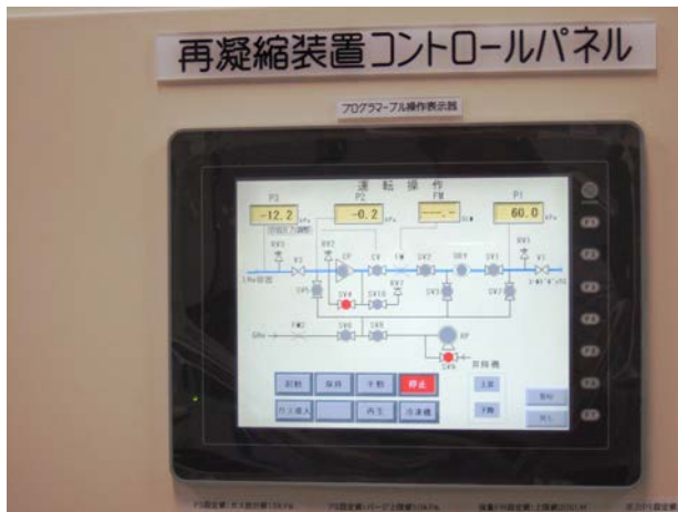
図7. ヘリウム液化装置制御盤置