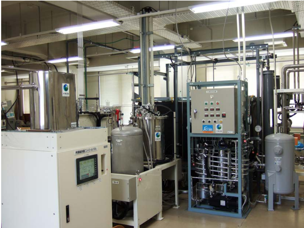
図2. 101室に設置されたヘリウム液化装置

ヘリウムに精製し、さらに、低温精製器（図2中）で活性炭等の吸着剤により、空気等の不純物を除去する。この低温精製器はGM 冷凍機 2 によって80 K 以下の温度に冷やしており、液体窒素を使わない方式である。