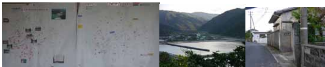
知名瀬地区の豪雨被災図と避難誘導支援者リスト・防災マップ 地区遠景 洪水水位線