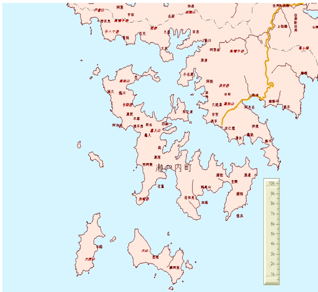
図1 瀬戸内町集落図

また、海上タクシー（不定期船）については、記録がないようであるが、定期船業者が必要に応じて、運行するという形をとっていたようである。海上運送法からすれば、違法行為でもあるが、実情を考えるとそのような形で運行されていたことは十分伺える。