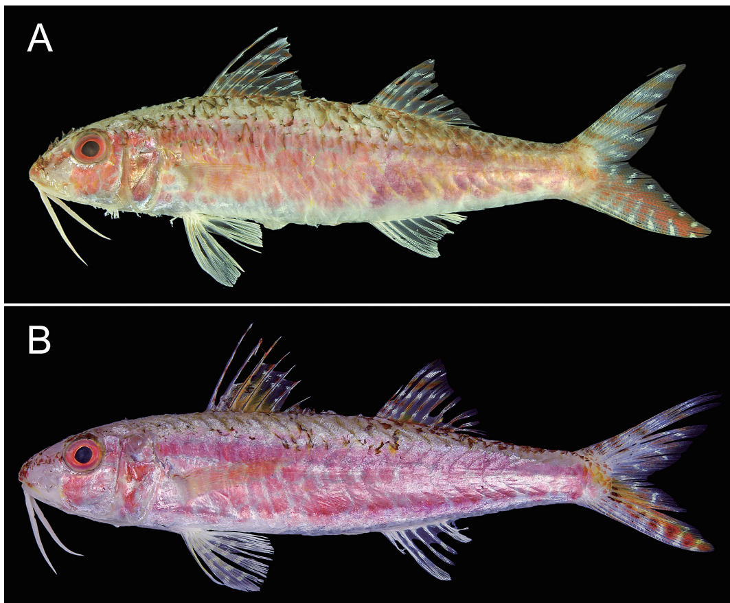
Fig. 1. Color photographs of fresh specimens of (A) Upeneus itoui and (B) Upeneus sp. A: KAUM-I. 59466, 102.6 mm SL; B: KAUM-I. 58746, 91.5 mm SL, Tanega-shima island, Kagoshima, Japan.