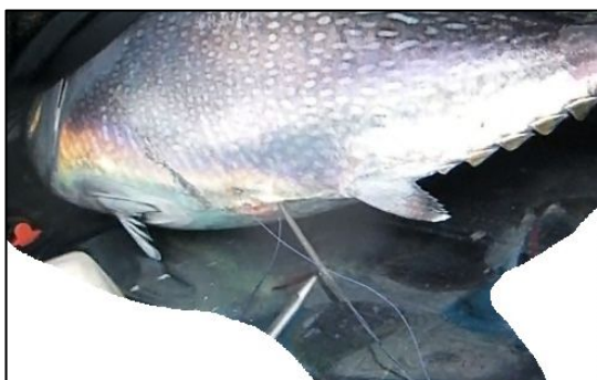
写真1 遊泳深度と温度を長期間記録可能な小型記録計をクロマグロ幼魚の腹腔内に装着する様子