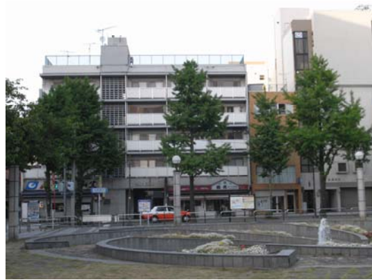
写真 1： 現在も民間賃貸住宅として運営されている 旧公団市街地住宅（福岡市内）

1983 年度末までに譲渡された 45 住宅のうち、20 住宅は現在まで建替えられることなく建物が維持されている。ただ、住宅地図上では居住者名の表記は少なく、業務・商業機能に転用されるなど居住機能は失われている場合が多い。関西で解体や建替が多く見受けられるが、いずれも近年おこなわれたものであった。