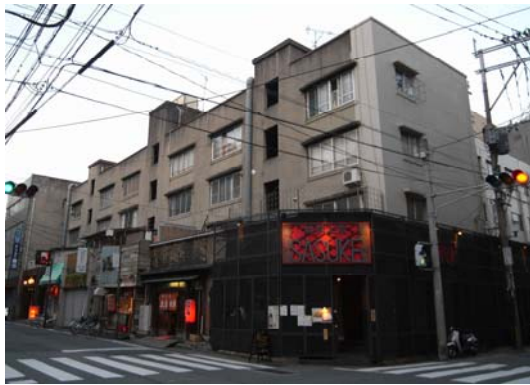
写真2： 譲渡後も健在の旧県営アパート（福岡市内）