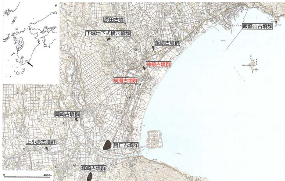
図2. 志布志湾沿岸地域の主要古墳群（橋本，2007）.

2個ずつ、短辺に各1個の縄掛け突起を持ち、突起を含む最大長は277 cm、最大幅が128 cmである（図3）。また、九州の刳抜式石棺は、熊本県に多く存在し、大分県臼杵から宮崎県延岡に至る地域でも知られている。