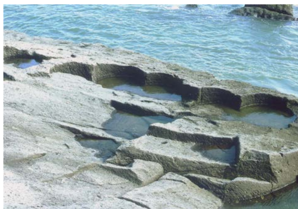
図5. 志布志市西夏井海岸；入戸火砕流の溶結凝灰岩を切り出した跡。

一方で、志布志市南東部の海岸地域には夏井（阿多）火砕流の溶結凝灰岩も分布しており、夏井の海岸では「黒石」として大量に石材として切り出された（迫田，1991）。切り出された時期はわからないが、入戸火砕流の溶結凝灰岩と同様、舟によって運搬され、おもに墓石に使用されたと報告されている。夏井（阿多）火砕流の溶結凝灰岩は、軽石を多く含む入戸火砕流の溶結凝灰岩に比べて肌理が細かく、均質で細工もしやすい利点があり、鹿児島県内には黒色の阿多火砕流の溶結凝灰岩を使用した墓石、手水鉢等が数多く残されている。このような両火砕流の岩石学的性質の違いから、古墳時代の石工が夏井（阿多）火砕流ではなく、溶結度の高い入戸火砕流の溶結凝灰岩を石棺として使ったと考えられる。