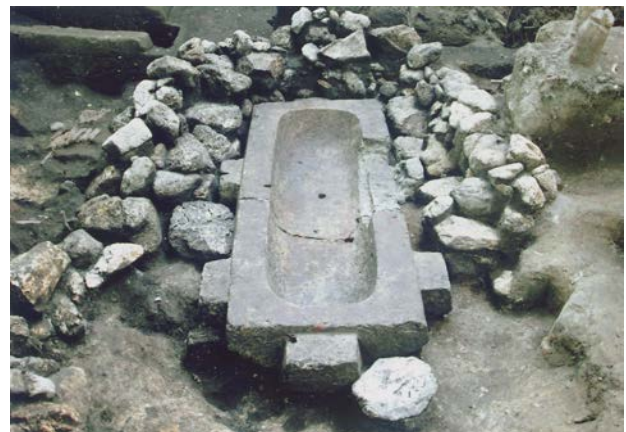
図3. 神領10号墳の石棺.

本試料はほとんど火山ガラスから成り、重鉱物は不透明鉱物のみで他には認められなかった。火山ガラスの屈折率は1.4982-1.4994で、AT テフラと特定できる。