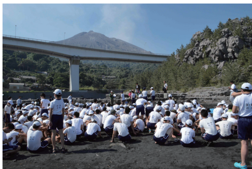
図1. 修学旅行生に桜島の魅力を語る NPO スタッフ。

の営みも含めて、それらがどのように繋がり影響し合っているのか、ストーリーを紡ぎながら教育普及活動を通して多くの人たちの学習の場としなければならない。