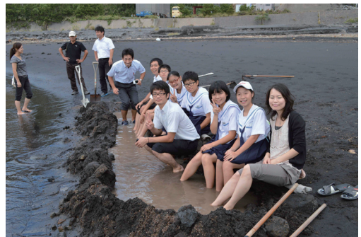
図3. マイ足湯を楽しむ黒神中学校の生徒と教師。