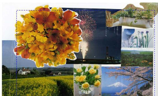
図6 コラージュ⑲ このころの中にたくさんの花

回(12/22)は、大きいパーツでコラージュ⑭『冬にぴったりな食べ物?』制作。中央にすき焼き鍋が貼られ、暖かい室内から窓外の冬の街を眺める風情である。3 回続けて食べ物が貼られ、現実行動に向けたエネルギー備給の印象がある。左下には‘“ふたり”と一緒にいたいから’の文字付きのリースが貼られ、SC や内的自己などの同行者が連想された。制作後、家族や恋愛観を語る。面接関係が深まった感覚があり、担任に見てもらうと「‘ふたり’って先生のことじゃない?」と言われ嬉しく感じるが、後日、表層的に浮かれていたと反省した。年明け以降、ほぼ毎週面接となる。受験期相応の将来展望をめぐる課題や、“二”のあり方に‘葛藤や緊張’から‘同行者やふたり’のような質的な変容を感じさせる表現が展開され、現実的な話題が増える。第 15 回(X+1 年 1/12) コラージュ⑮制作。左側の大きな温泉宿の室内とは真逆の高い冬山が中央から右側に三枚貼られ、自己像を連想させる小さな登山者が登場し、自己像を思わせる小さなイラストの狐が重ね貼りされる。これまで溜めたエネルギーをもとに課題と対峙しようとする印象がある。良好な登校状況や推薦入試での緊張などが語られる。てんかん発作が起き不安であったことも語られる。第 16 回(1/19)は、中程度のサイズのパーツでコラージュ⑯『車に乗って遊びにいこー!』制作。全体的に寒色のやや寂しい色合いである。冬山は少し遠ざかる配置で、右下の門扉は閉ざされている。他方、左下には大きなアウトドア車が左向きに貼られ、内面に向き合う力強さが伝わってきた。第 17 回(1/26)コラージュ⑰(図 4)は、モノクロだが初めて同世代の少年達が右下に配置される。上部には「合格していたら(左)」「不合格なら(右)」と躍動するカラーの“女性が二枚”配置される。左側は中程度の彗星や疾走する道路で、吸い込まれそうな勢いであり、目眩を感じるほどの急激な変化が連想される。制作後は、調理系専修専門学校への期待が語られる。担任から、合格通知が来ているが「調子に乗らないようしばらく伝えない」方針が伝えられる。第 18 回(2/2)コラージュ⑱『心の落ち着く場所』は、大きいパーツで構成される。“二”刀流の‘宮本武蔵’が文字で表現され、専門と高校資格の双方を取得できる進路と重なった。文字メッセージ‘果てしなき道の出発地’が添えられており、出立を意識し始めた A 君の内界が推察された。第 19 回(2/9)は、珍しく小さめのパーツのみでコラージュ⑲『夢があれば心はハッピー』を制作。合格が伝えられた直後で、左下には合格祝いを連想させる水上花火が配置され、左上の授業風景と右側の調理実習風景が少し大きな虹と気球で繋がれていた。成長不安と同時に喜びが素直に表現されていた。そ