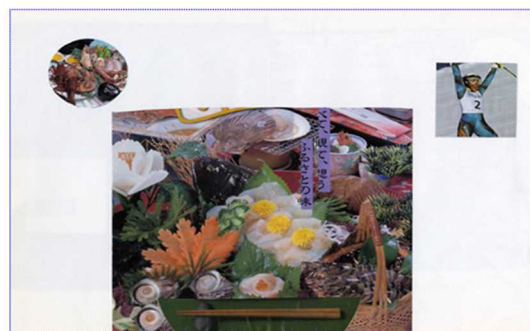
図5 コラージュ⑲ 日本料理が一番、オリンピックも、一番