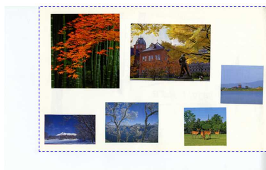
図3 コラージュ⑪ 春がない

が重ね貼りされる。SC が＜コラージュ以外でお話したいことはない？＞と聴くと「これ（コラージュ制作）がいい」とにこにこして答える。 第 9 回(9/18 いつもと違う曜日) コラージュ⑨『ジャングルかな？』制作。初めて大きめのライオンやキリンなどが選択され、丁寧に切り抜いて貼付される。この時期まで、登校や受験などの現実課題は全く話題にされないことに、SC は焦りを覚える。それに呼応するように無断キャンセルが続き、担任は「学校祭疲れではないか」と言う。さらにキャンセルが続き、担任からの依頼もあり、SC 側のアクティングアウトといえる行為をためらいながらも電話を入れる。A 君は「しんどい」「学校祭疲れではない」と言う。再度、面接契約を確認し、＜今後は私から電話は入れませんが、待っていますね＞と伝える。電話後、SC は完全不登校が必要な時期かと考え受け止める覚悟と同時に、心許なさも抱いた。 第 10 回(10/20) 大きなパーツのみでコラージュ⑩『ふるさと』を制作。左側は公園で、俯瞰的な古民家の風景が右側に大きくはみ出し、中央には初老の男性が後ろ向きで家に向かう構成で、今にも引きこもりそうな懸念を抱く。 第 11 回(10/27) コラージュ⑪『春がない』制作(図 3)。小さめの夏秋冬の“風景が二枚ずつ”貼られる。秋のパーツは二枚ともやや大きく、A 君にとって現実の秋が重く体験されていると推察された。「がんばらないと」と繰り返す口にする。＜（コラージュのように）春がくるといいね＞と語りかけると涙ぐむ。担任から、やる気がなくひきこもり状態であると知らされる。この後、SC の出校日のみ欠席するようになり 1 ヶ月ほど中断する。担任と話し合い、さまざまな影響を検討した上で、11 月中旬に＜A 君なりに心のなかで試行錯誤しているのだろうな＞という応援の思いを込め、海上を左方向に進む一隻の船を貼った八つ切り画用紙半サイズのコラージュを制作し、厳封して担任に託した。