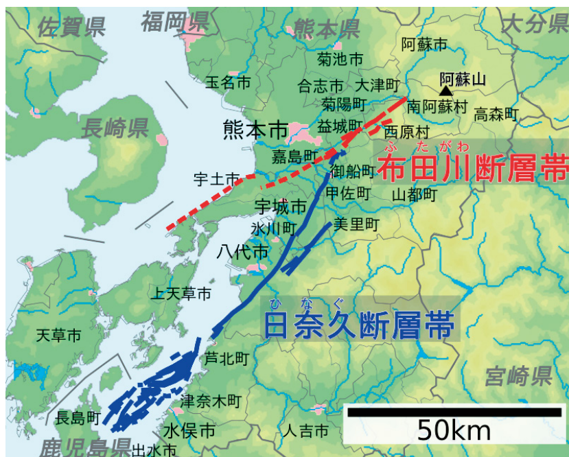
図1 熊本地震概観（活断層）と市町村位置