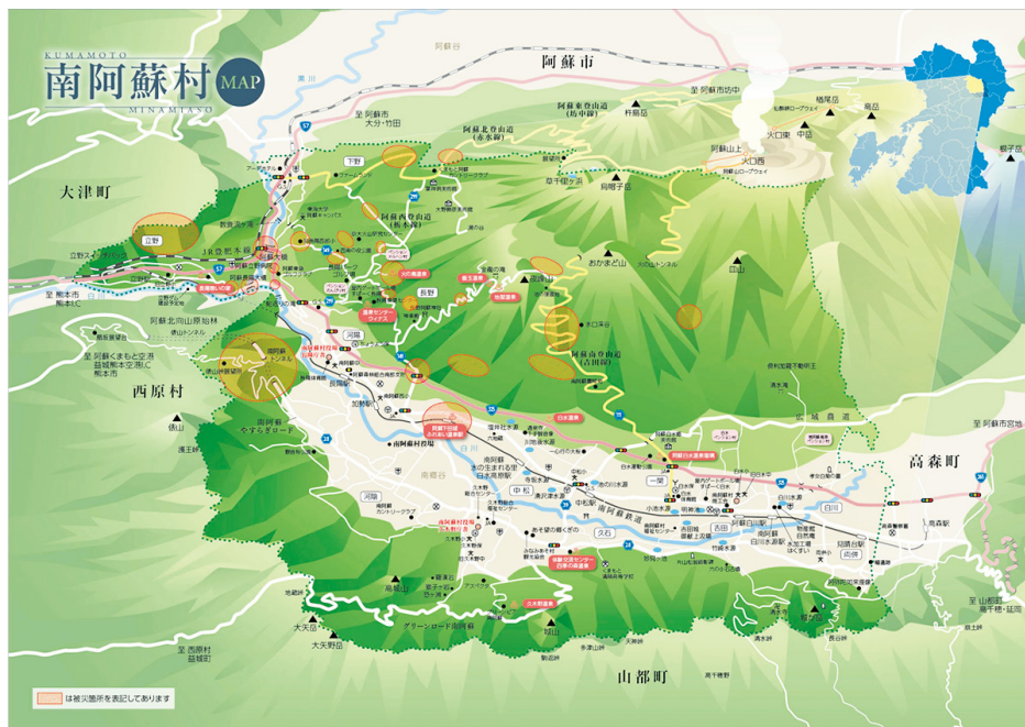
図2 南阿蘇村と西原村の位置関係