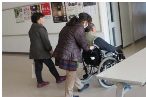
写真 19. 車椅子の方を支援する様子