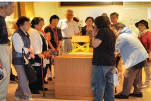
写真 7. 模型を用いて地震について学ぶ様子