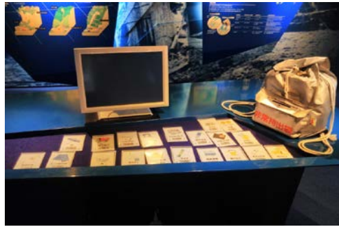
写真 6. 災害時に必要な物のカード・非常持出袋