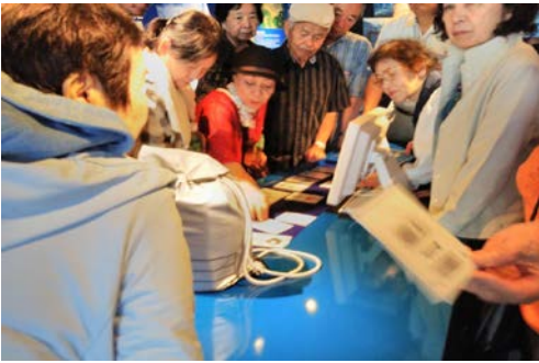
写真 5. 災害時に必要な物を話し合う様子