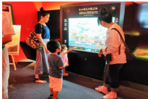
写真 4. 火山噴火についてゲームを通し学ぶ様子