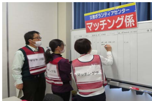
写真 17. マッチングの様子