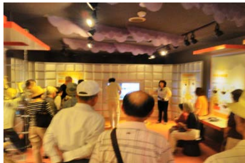
写真 8. 火災発生時の模擬体験中の様子