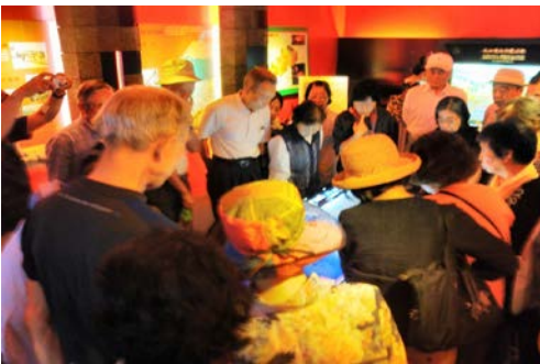
写真 3. 火山の立体モデルを見学する様子