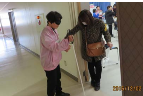
写真 18. 視覚障害者（疑似）を支援する様子