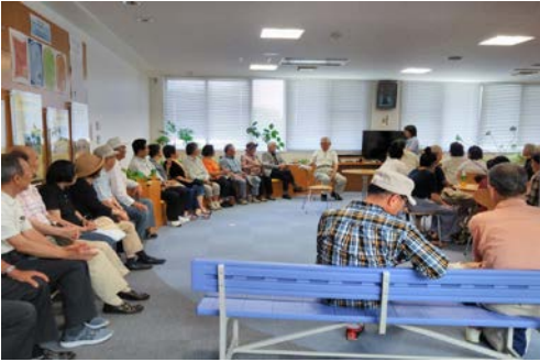
写真 1. 非常持ち出し品の重さを予想する様子

真 3～8)。また、展示案内員の方の説明やクイズも行われた。③では、想定外の揺れへの備えや避難生活の質、備蓄等について映像を視聴（写真 9）した後、関連する実物を用いながら職員の方の講話が行われた。特に、水の備蓄についてのポイントを確認した。④では、住んでいる地域にある避難場所等の写真資料を用いたクイズを通して、自分が住んでいる場所から一番近い避難場所の確認、Jアラートについての説明が行われた（写真 10）。