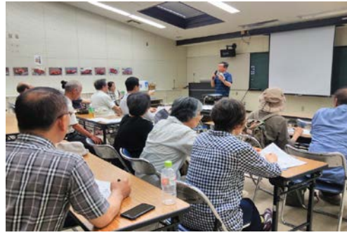
写真10. 地域の避難場所等を確認している様子