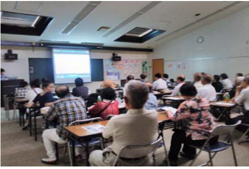
写真9. 映像を視聴中の様子