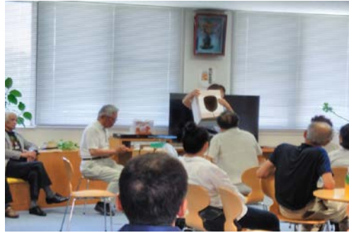
写真 2. 簡易トイレについての講話の様子