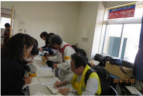
写真 13. 登録カードの記入の様子