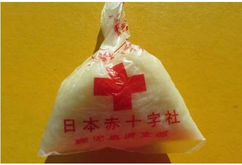
写真 11. ハイゼックス