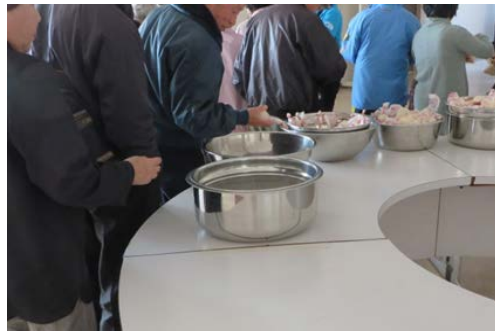
写真 12. 参加者へ配布している様子