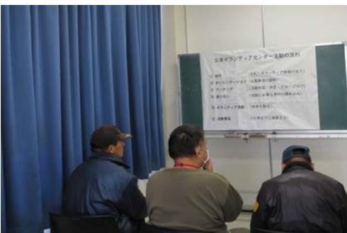
写真 16. オリエンテーションの様子