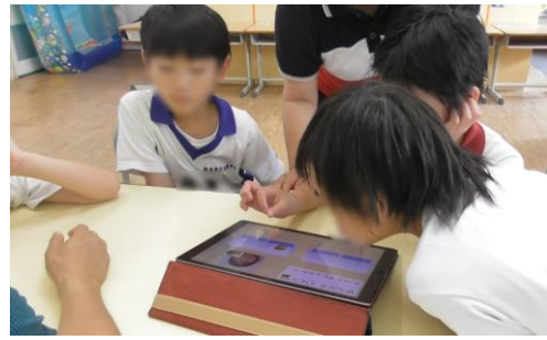
写真2 友達の活動の様子を見るAさん

端末の数字ボタンで自分の考えを示すことで、周囲の教師や友達からの称賛があり、そのことが課題に取り組もうとする動機の高まりにもつながったと考える。