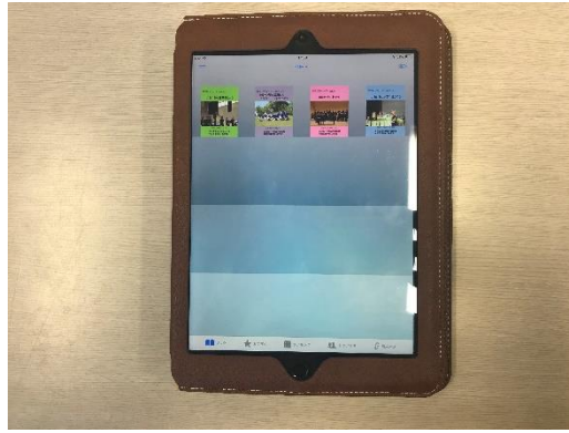
写真5 タブレット端末に整理された必勝ブック

の内容の中でも、買物における割引、消費税の計算やバスの時刻表の読み方など、生活の中で使用頻度の高い内容を中心に担当教師が整理したもので構成している。必勝ブックは、教師が授業時にシートを配付し、生徒がB5ファイルに貼る形式をとっていたが、生徒全員がタブレット端末を持つようになった現在は、教師のタブレット端末から、生徒のタブレット端末に一斉送信できるデータの形式をとっている。