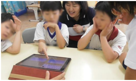
写真1 タブレット端末を操作するAさん