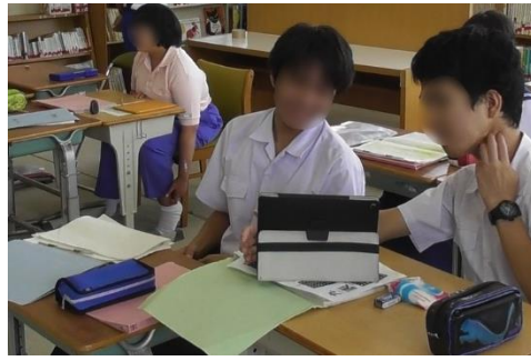
写真6 必勝ブックのに入ったタブレット端末を活用しながら学習に取り組む様子