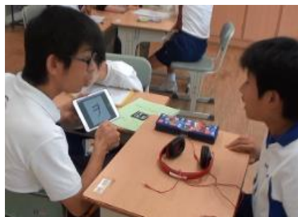
写真3 片仮名の学習をするBさん