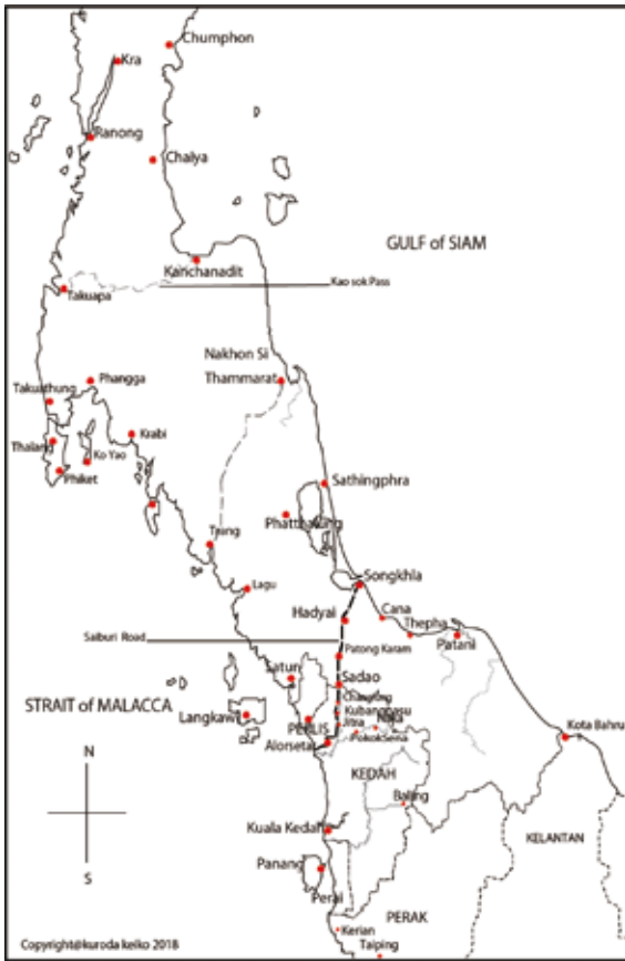
Map1. マレー半島中部図